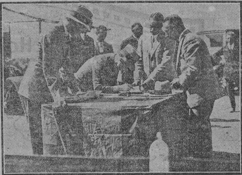
En la Isla Menor.—El Principe de Gales firmando en el album.

ESTE NUMERO HA SIDO VISADO POR LA CENSURA GUBERNATIVA