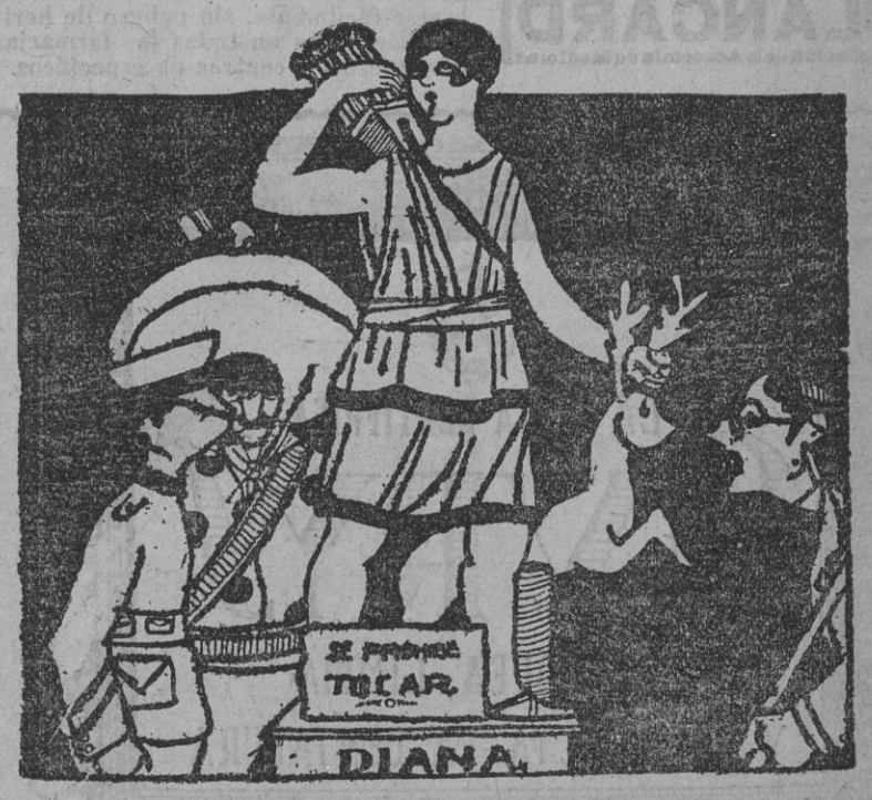
EN EL MUSEO

EL LIBERAL publica sus ediciones: De la noche, en las páginas 1, 2 y 3. De la mañana, en las páginas 4, 5 y 6.