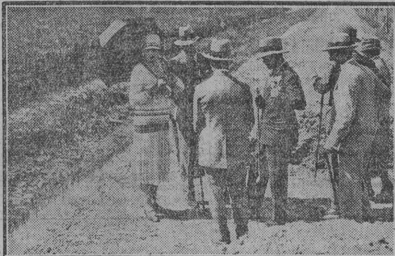
La reina y los Principes ingleses en los terrenos de La Marismilla.

Durante el reinado de los Zares fué propietaria de una gran fortuna y en la actualidad estaba en la mayor miseria.