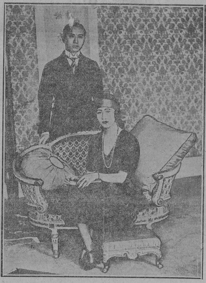
El representante de China en Londres, hoy ministro de Negocios Extranjeros de su país, doctor Wellington Koo, que ha enviado al Gobierno inglés una enérgica Nota de protesta por el envío de tropas á China. En la fotografía le acompaña su señora.