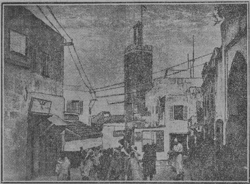
Típica vista del Zoco Chico de Tánger, cuya población se pide sea incorporada á la Zona de Protectorado español, esperándose sea concedida en la próxima Conferencia de París.

Entre los dos términos, reformas y expropiación, la edilidad ha de poner activamente sus energías. Ni puede esquivar la reforma ni puede evitar la expropiación. Los plazos que se tome para la una ó la otra no le eximen de la obligación de realizar tal mejora. Indiscutible lo que decimos, y conforme la opinión pública sevillana en que el Mercado de la Encarnación es una vergüenza y constituye un flagrante atentado á la higiene de la ciudad, ¿por qué motivo, derechamente, no se va á ese recurso de expropiación forzosa, en cuanto en ningún caso es más patente la utilidad pública y el Estatuto municipal encaja de lleno en la virtud de esta reforma urgentísima, cuya realización debió acoeterse hace muchos años?