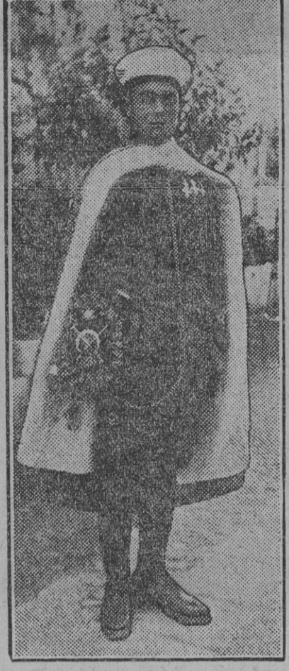
La escuadra de airosos y gallardos gastadores-lanceros...