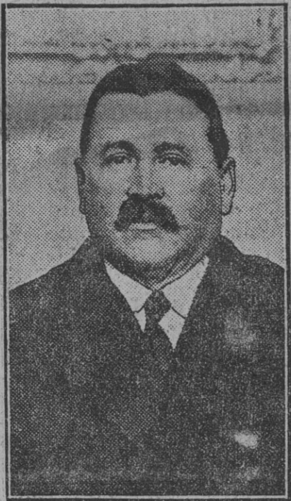
DON ADOLFO JOFRE Que dió una notable conferencia en la Casa de Extremadura el sábado por la noche.

El alcalde, señor conde de Bustillo, manifestó esta mañana a los periodistas que mañana por la mañana llegará a Sevilla desde Jerez de la frontera, el ministro de Fomento, señor conde de Guadalhorce, ilustre hijo de nuestra capital. El almuerzo tendrá lugar a la una de la tarde. El ministro marchará en el expreso del mismo día a Madrid.