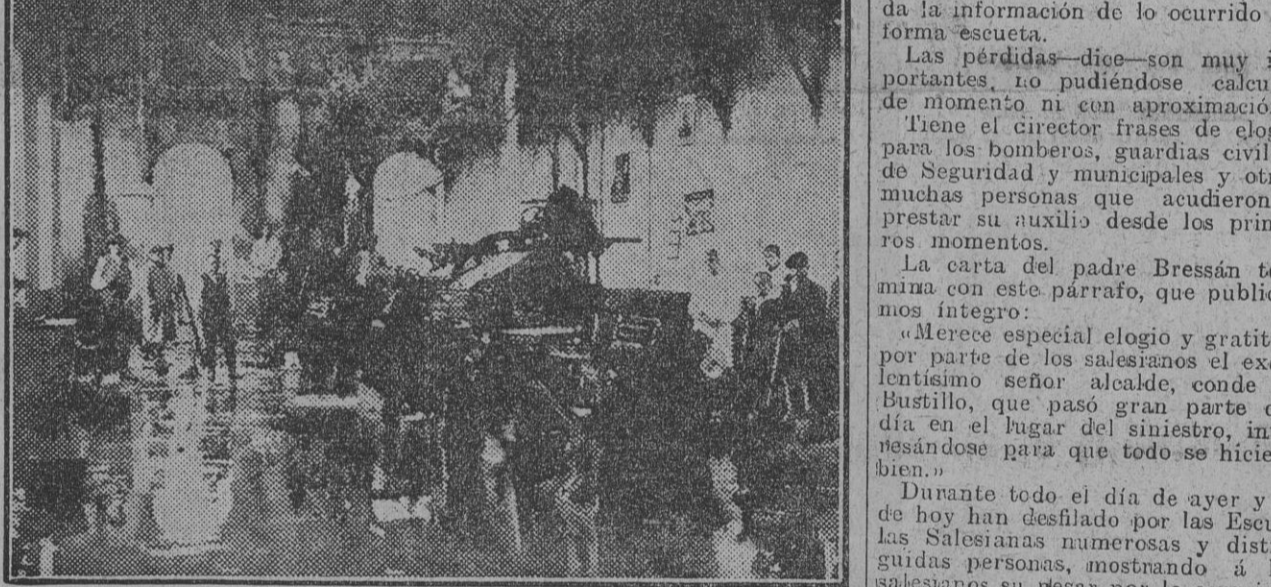
Una vista del taller de imprenta, momentos después de ser sofocado el incendio.

La zapatería (almacén y taller). El almacén de papel de la imprenta, que estaba abarrotado de toda clase de impresos, muchos de ellos libros sin encuadernar. Para determinar las pérdidas de este departamento hay que esperar el inventario que haga el maestro.