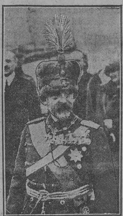
El Rey Fernando de Rumania, cuya gravedad extrema hace temer un funesto desenlace.