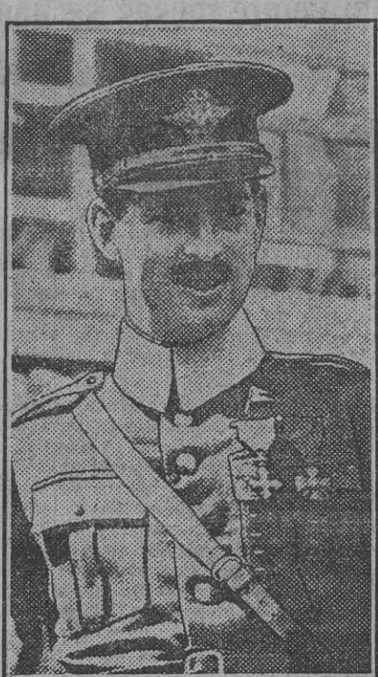
El príncipe Carol, heredero de Rumania, a quien Pedro su esposa dio millones de francos de indemnización.

Madrid 3.—Ha sido propuesto para ocupar la presidencia del Consejo Superior de Unión Social Agraria el conde de los Andes.