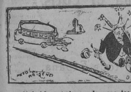
—¿Y había usted pegado para las dos secciones...?