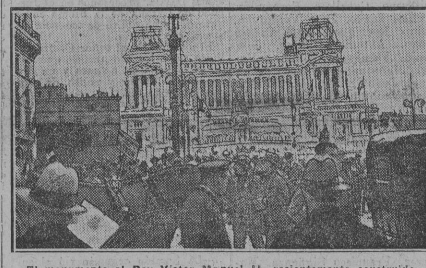
El monumento al Rey Victor Manuel II, recientemente construido.

Un querido amigo nuestro, sevillano por los cuatro costados, pero que por su carácter serío y formal más bien parece de Aragón, ha regresado hace poco de Roma y Génova, donde ha permanecido en viaje de recreo mes y medio. Escuchando noches pasadas las impresiones de su viaje, hemos creído oportuno trasladar al público algo de lo mucho interesante que cuenta este sevillano, que después de elogiar a Italia en todos los ór-