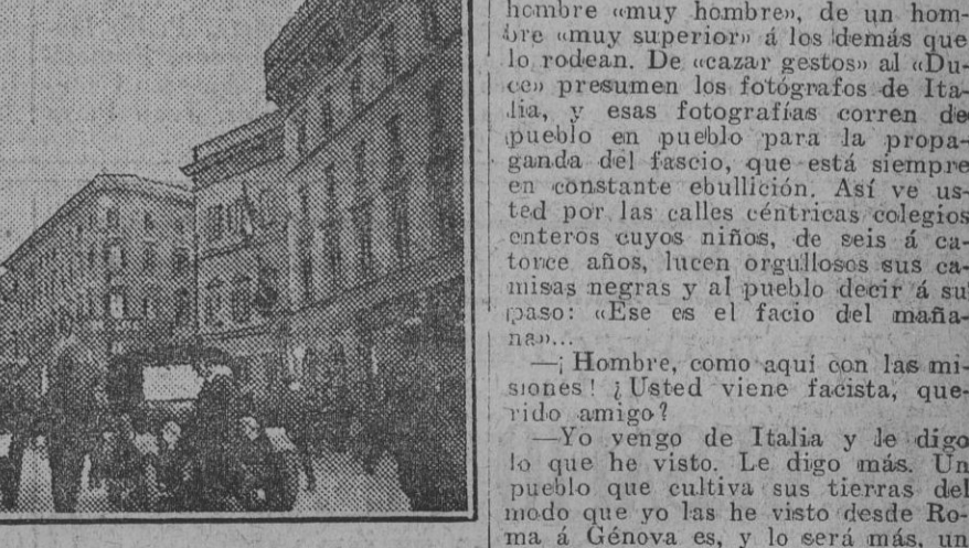
Un grupo de estudiantes fascistas reunidos en una plaza pública para organizar una manifestación, cosa que ocurre casi todos los días.

eléctricos, y si vamos a tomar a en el escaparate de un establecimiento céntrico. La Marina es la obsesión de Mussolini y los marinos ven en él a un hombre sobrenatural. —¿Vio usted al «Duce»? —Sí. Y lo escuché hablar. Hablaba al pueblo el día del armisticio desde el balcón de un edificio que hace esquina a dos plazas, donde había millares de personas. Mussolini es un hombre fuerte, corpulento, sin ser muy alto. ¡Comprende usted! De ceño duro, gesto severo y mirada penetrante. Acaso en estilo de la mirada penetrante haya algo de «gruse», porque constantemente están los ojos como clavados en un objeto fijo; persona o cosa. Quiere aparecer así como trágico, sin que acaso por su imaginación cruce la tragedia. Pretende dar, y la da para la mayoría, la sensación de un