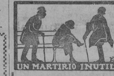
UN MARTIRIO INUTIL