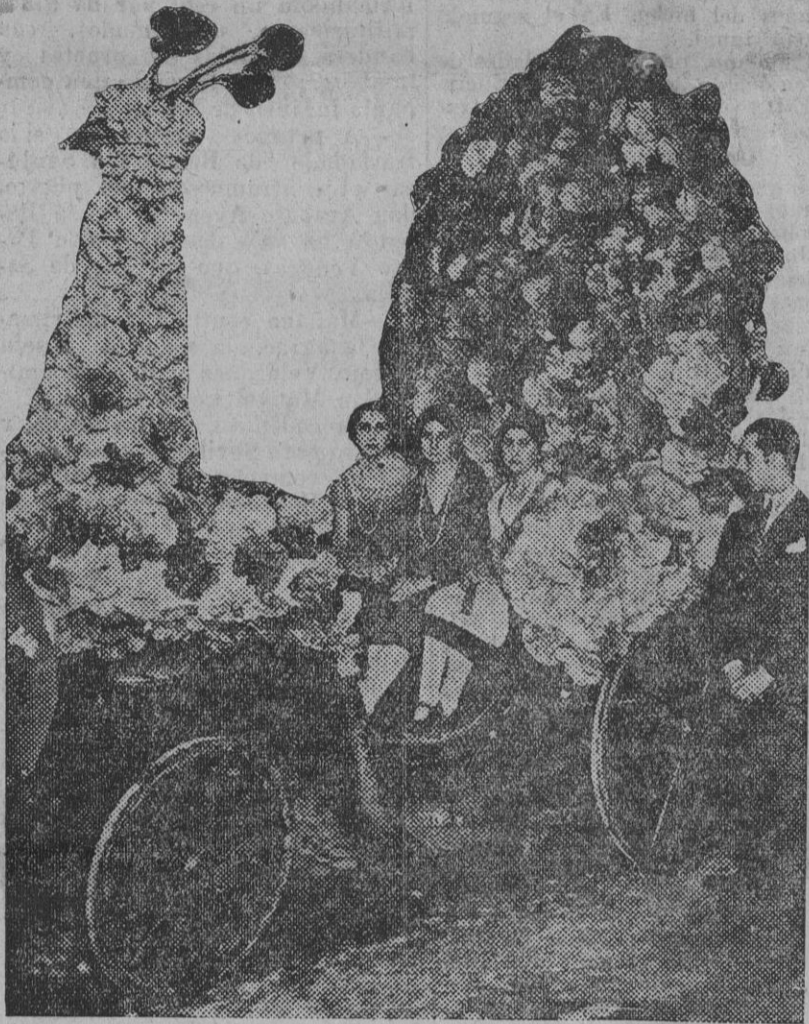
El coche adornado que figuró en la cabalgata de anoche, ocupado por tres de las señoritas premiadas en el concurso de belleza.