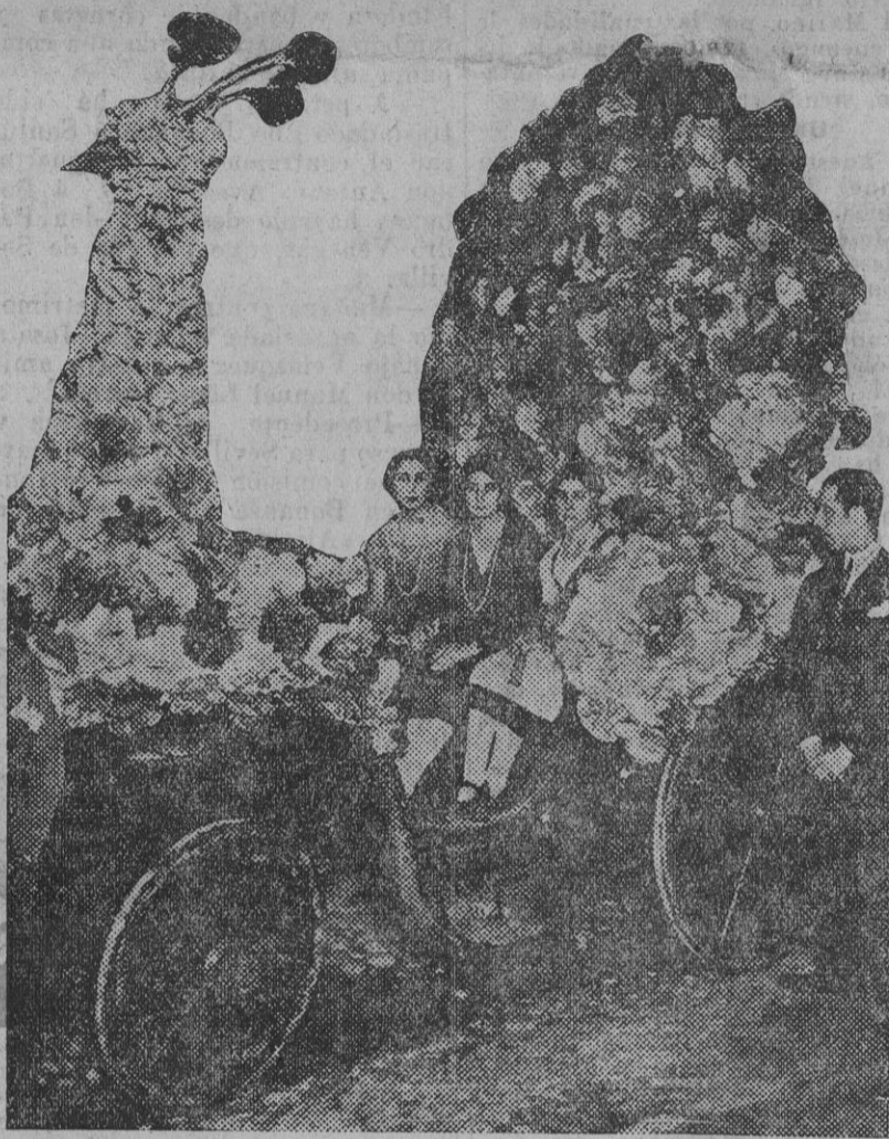
El coche adornado que figuró en la cabalgata de anoche, ocupado por tres de las señoritas premiadas en el concurso de belleza.