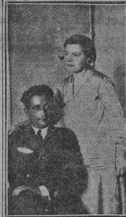
El comandante Franco, acompañado de su esposa. Única fotografía íntima obtenida en su casa particular después del «raid» Palos-Buenos Aires.

(Vean nuestros lectores la amplia información que publicamos en la plana tercera.)