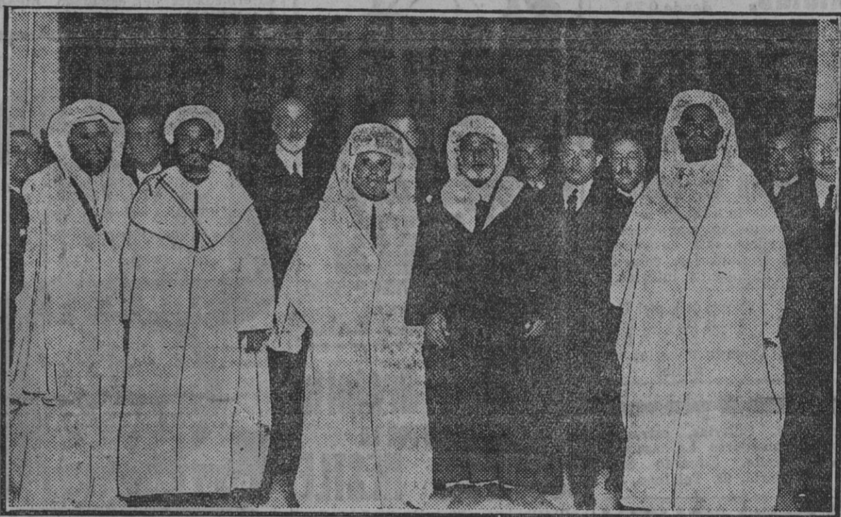
Socios del Nuevo Casino que obsequiaron ayer tarde con un té á los cinco caídos millenses. (Fdo. Gori)