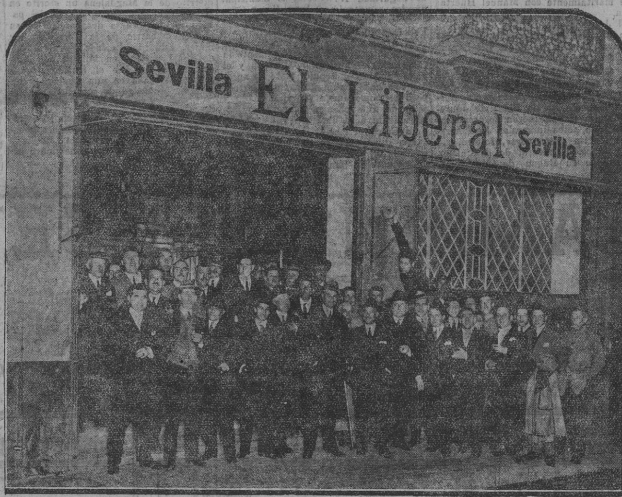
El director, el administrador, los redactores y personal de la Administración y talleres de EL LIBERAL, en la puerta de nuestra casa—la de nuestros lectores—después de la fiesta íntima con que celebramos el vigésimo quinto aniversario de la aparición del periódico

co, pues, suponer que en un principio el Sol no fue otra cosa sino la reunión de todo el sistema planetario en una masa gaseosa, cual lo que llamamos nebulosa, en el cielo?