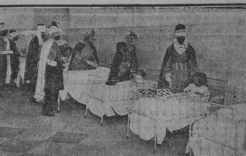
Curiosa nota gráfica de la visita que hicieron varios enviados de los Magos de Oriente al Hospital Provincial para hacerles entrega de juguetes a los niños acogidos en la Sala Borbolla

ERUPCIÓN VOLCÁNICA. Santa Fe.—Se ha producido una erupción volcánica cerca de Porto, la cual ha causado grandes daños. La población fué presa de gran pánico, habiendo ocurrido numerosas víctimas.