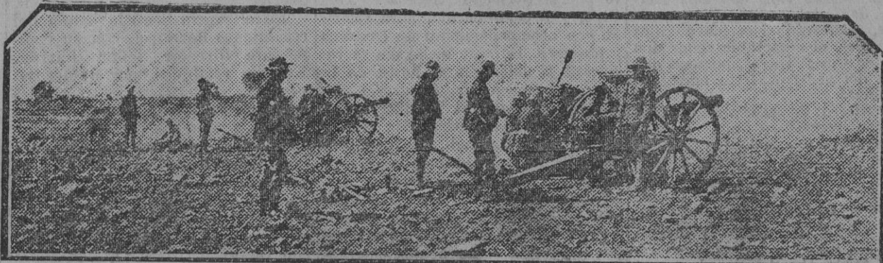
TETUAN.—La artillería protegiendo el avance de las tropas á Kudia Tahar.