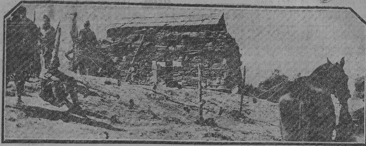
TETUAN.—Uno de los pequeños puestos de la línea Ben Karrich, fuertemente atacado por los rebeldes y rescatado por nuestras tropas.

Este número ha sido visado por la censura gubernativa.