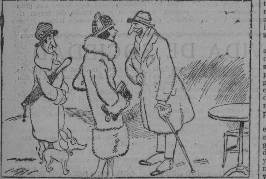
Ella - Vd. debe hablar con mamá, si Vd. aspira a ser un hombre. Él - ¿Yo? ¡Aspirina nada más... y Bayer por más señas!