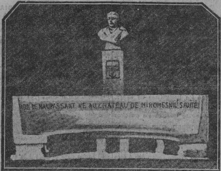
Monumento erigido en el parque del Castillo de Miromesnil, cerca de Dieppe, é inaugurado el pasado domingo bajo la presidencia de M. de Monzie, ministro de Instrucción Pública.