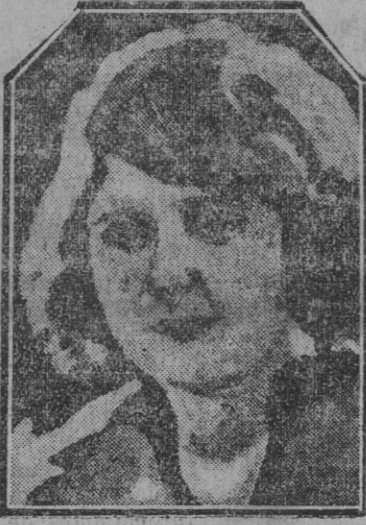
Belle norteamericana, que á su paso por Londres ha hecho entre otras predicciones la de que Lloyd George será en 1929 Presidente de la República inglesa.