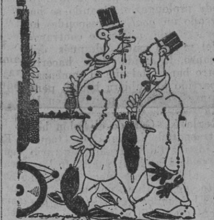
LA PEÑA DEL AGREEDOR