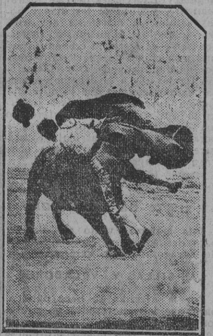
El debutante Cuerrillero, al ser cogido por su primer miura, tercero de la tarde.