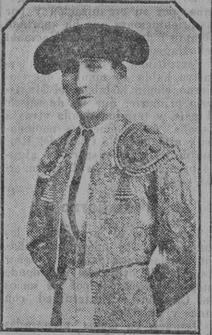
Ex novillero que ayer actuaba de peon y que sufrió una gravísima cogida durante la lidia del sexto novillo.

Este número ha sido visado por la censura gubernativa