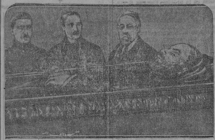
Primera guardia de honor ante el cadáver de Lenin, prestada por Kamenef, Zinovieff y Tomsk;