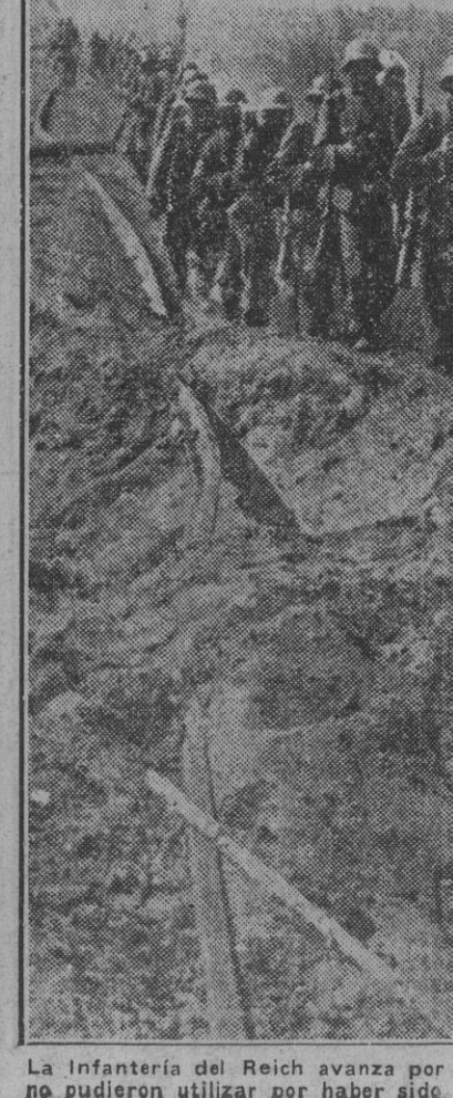
La infantería del Reich avanza por la vía férrea que los bolcheviques no pudieron utilizar por haber sido alcanzada en eficaces bombardeos.