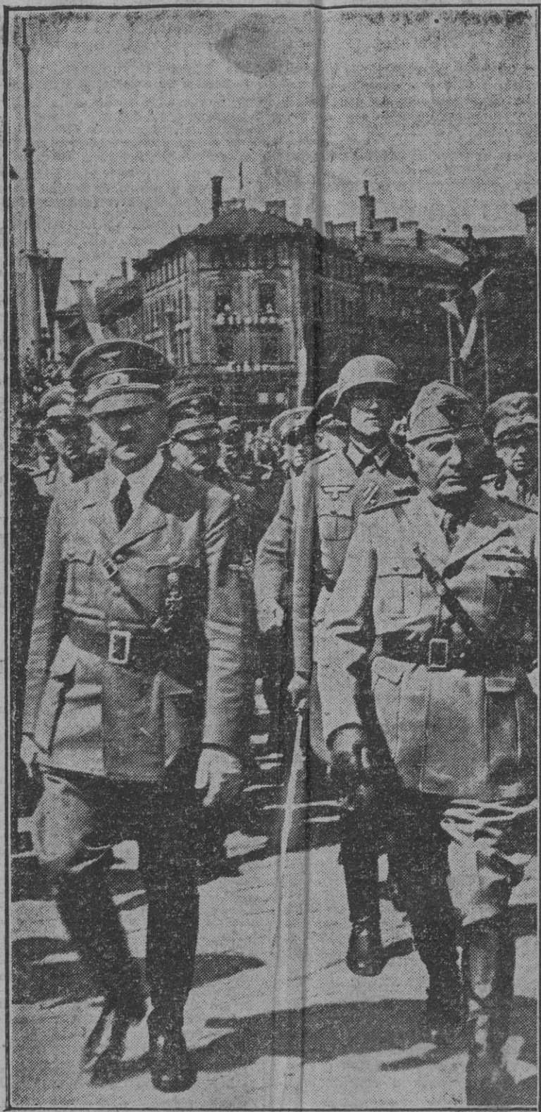
Los dos jefes de los pueblos del Eje han vuelto a reunirse para trazar sus planes y las directrices que han de llevar a una paz duradera con la colaboración de las revoluciones europeas por ellos capitaneadas. Tras de todas las entrevistas Hitler-Mussolini, el Mundo espera acontecimientos en la marcha de la guerra.