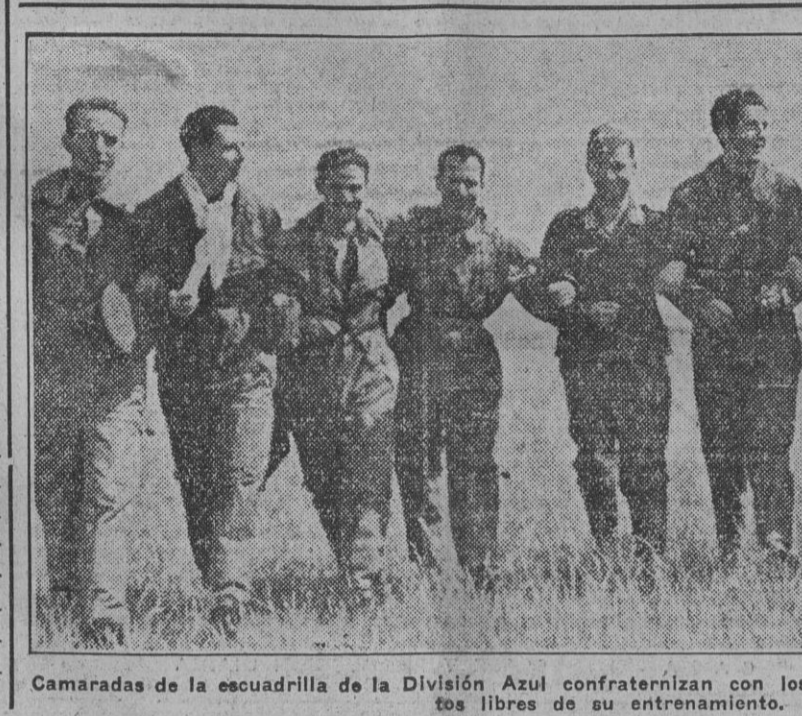
Comaradas de la escuadrilla de la División Azul confraternizan con los aviadores del Reich en los momentos libres de su entrenamiento.

WASHINGTON, 12.—Las relaciones francoamericanas son cada vez más tirantes y no sería de extrañar que se llegara a una ruptura diplomática en cualquier momento, declaran los círculos bien informados de Washington. Añaden que las circunstancias se han agravado desde el momento de la entrada de los japoneses en Indochina. (Efe.)