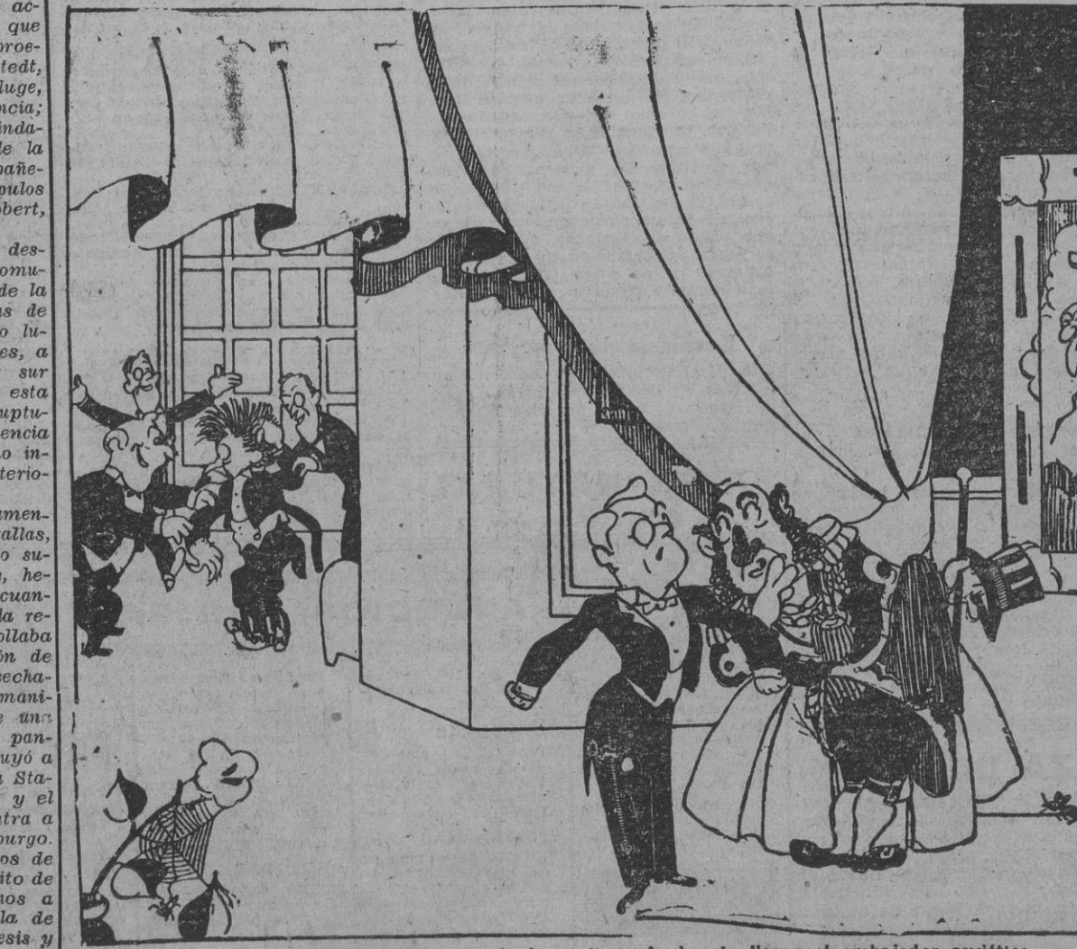
—El señor me debe dejar que le guarde la cartera. Acaba de llegar el embajador soviético.