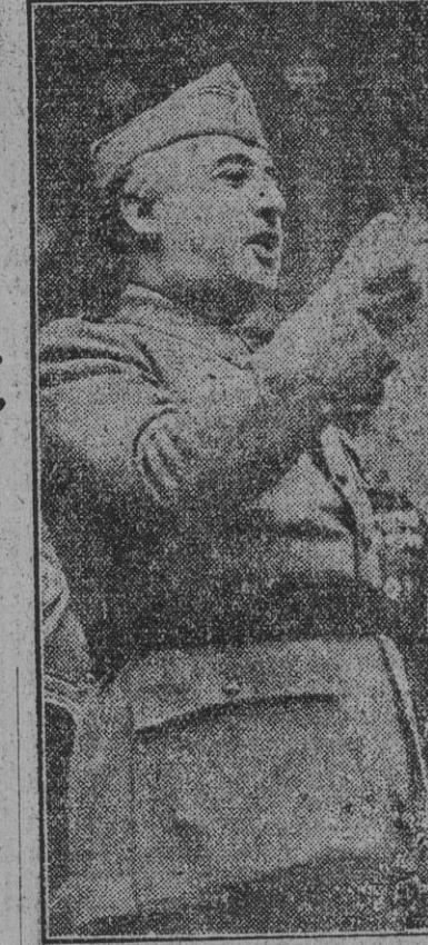
El jefe del Estado y Generalísimo de los Ejércitos, en un momento del discurso que hoy pronuncia en las gloriosas ruinas del Alcázar.