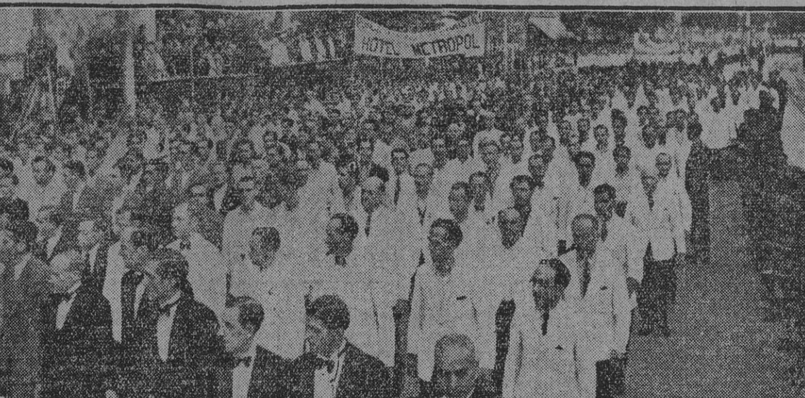
gunda reproduce el paso del Sindicato de Hostelería y Similares. Los servicios de hoteles y establecimientos, con sus jefes de empresa a la cabeza, figuraron en la manifestación.