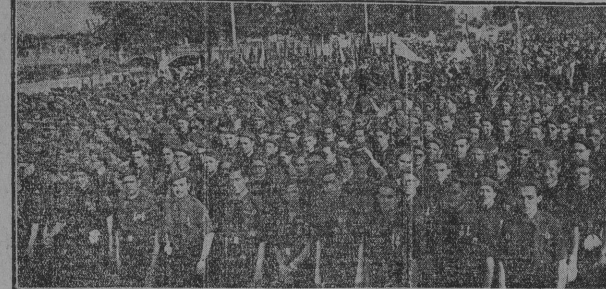
La Milicia de la Falange valenciana forma en la plaza de América para la gran concentración con que Valencia ha hecho acto de presencia en la fiesta española de Exaltación del Trabajo...