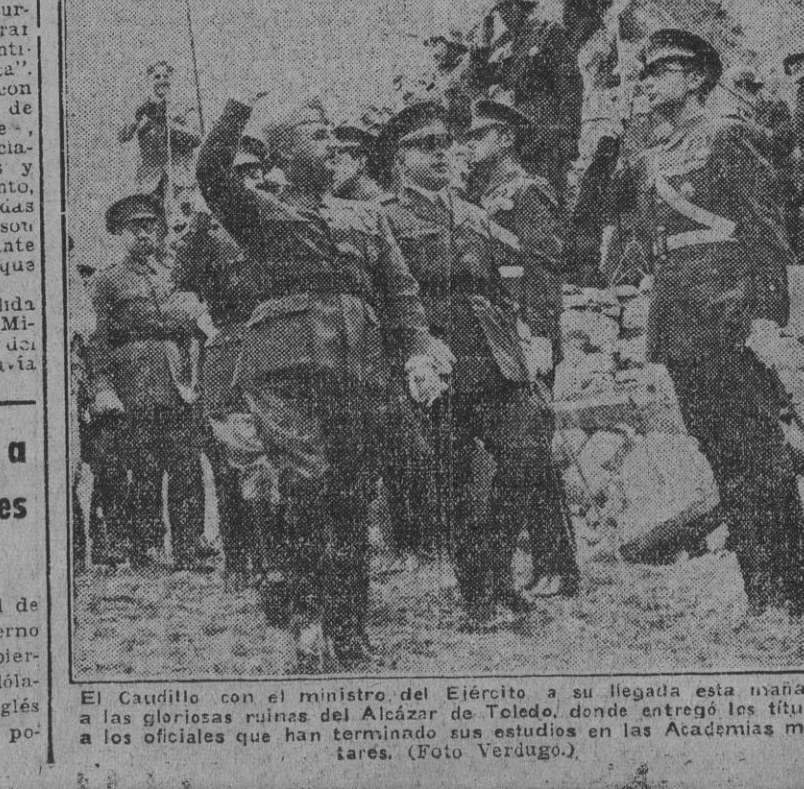
El Caudillo con el ministro del Ejército a su llegada esta mañana a las gloriosas ruinas del Alcázar de Toledo, donde entregó los despachos a los oficiales que han terminado sus estudios en las Academias militares.

WASHINGTON, 22.—En virtud de un acuerdo ya firmado, el Gobierno norteamericano prestará al Gobierno británico 425 millones de dólares para que el presupuesto inglés se equilibre en la medida de lo posible. (Efe.)