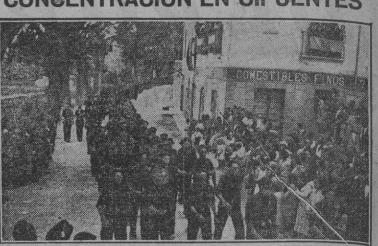
Desfile en la concentración celebrada en Cifuentes el domingo 29 de junio.