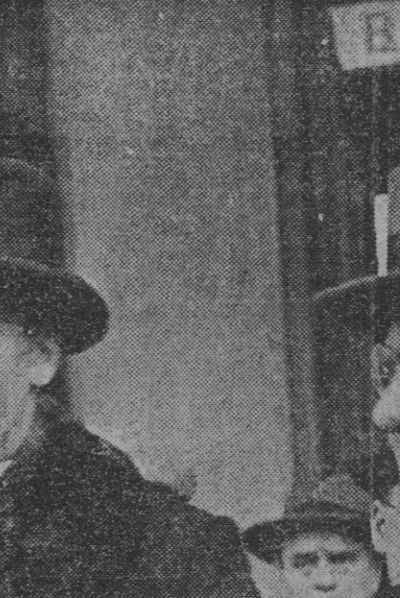
El capitalismo ayuda y el capitalismo democrático estuvieron siempre unidos y vuelven a estarlo en el momento decisivo en que la historia ha dictado su fallo inexorable. Los rostros sonrientes de Eden y Litvinov aparecen aquí mostrando la satisfacción de su coincidencia con motivo de la visita que Eden hizo a Moscú el año 1935, cuando preparaba el cerco contra Alemania, que Von Ribbentrop hizo fracasar.

En África Oriental, ante Debra Tabor, nuestras heroicas tropas han rechazado un nuevo ataque del enemigo." (Efe.)