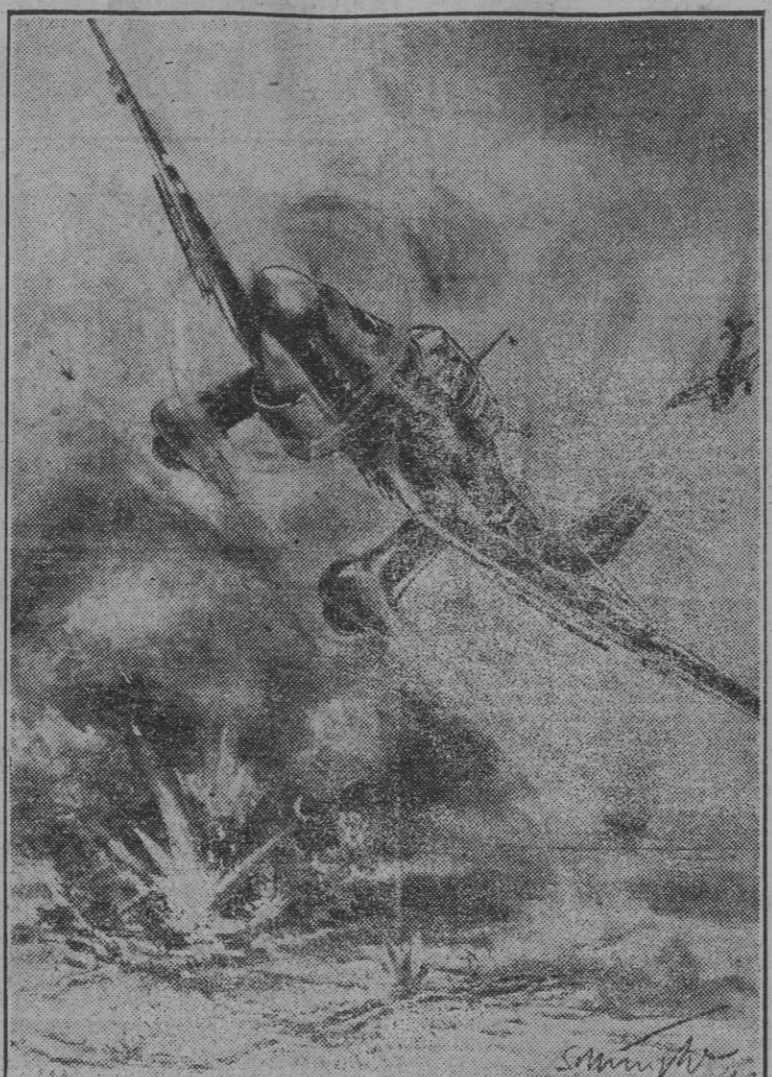
Los Stukas machacaban incesantemente las concentraciones y principales vías de comunicación del adversario. El dibujo muestra el momento en que uno de los aviones alemanes de este tipo ataca las fortificaciones de Tobruk.