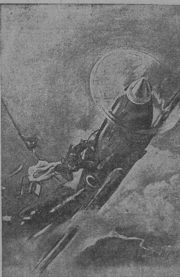
La lucha en el aire es dura y llena de emoción. Máquinas y hombres son lanzados al espacio por la gigantesca fuerza de los motores y de la moral que impulsa a los pilotos. Luego, el de peor suerte o menor técnica es abatido. He aquí un momento interesante de una lucha entre aviones rápidos.

Se sabe que Inglaterra, reducida a los recursos de Suiza, no puede vivir en tiempos de paz, como en tiempos de guerra. Vamos a citar en apoyo de nuestras afirmaciones algunas cifras de importación de los puertos de Ultramar más importantes de la Gran Bretaña durante 1937: siete puertos, a saber: Southampton, Bristol, Liverpool, Manchester, Hull, Newcastle y Glasgow. En estos servicios, la aviación alemana vigila las rutas de acceso alrededor de la Itra y aun a centenares de kilómetros más allá del Océano. Sus aviones de combate, de acuerdo con los submarinos, todo barco de guerra o de comercio enemigo. Bombas, minas y torpedos son en estos tiempos de paz, como en tiempos de guerra. Vamos a citar en apoyo de nuestras afirmaciones algunas cifras de importación de los puertos de Ultramar más importantes de la Gran Bretaña durante 1937: siete puertos, a saber: Southampton, Bristol, Liverpool, Manchester, Hull, Newcastle y Glasgow.