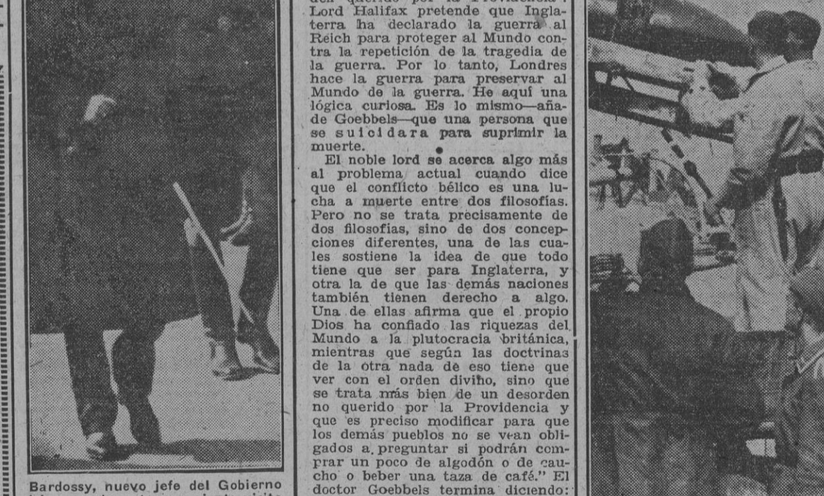
Bardossy, nuevo jefe del Gobierno húngaro, durante su reciente visita a Berlín...