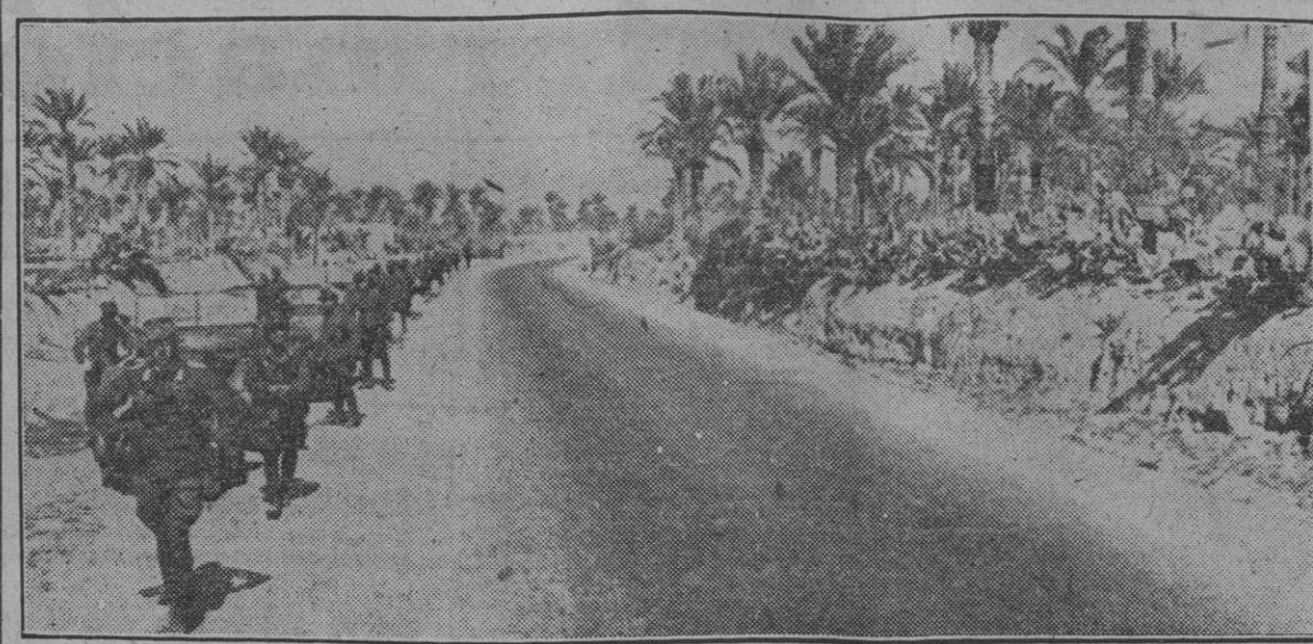
Después de largas jornadas, las tropas alemanas motorizadas hacen un alto en el camino para repostar...