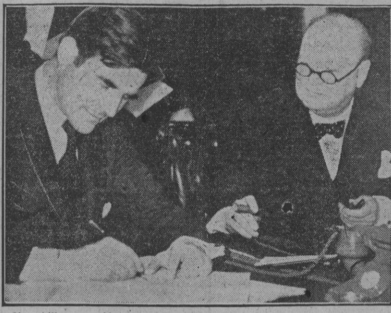
Churchill presenció la firma del Convenio por el que Inglaterra cede bases navales del Atlántico a Estados Unidos...