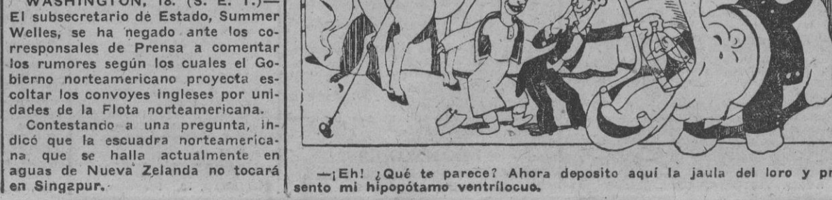
—¡Eh! ¿Qué te parece? Ahora deposito aquí la jaula del loro y presento mi hipopótamo ventrílocuo.

ATENAS, 18.—El Rey Jorge de Grecia ha dirigido a sus tropas la siguiente orden del día: "Oficiales y soldados: Cuatro meses de violentos combates, cuatro meses de lucha heroica contra el enemigo numéricamente superior, no sólo no han concluido con vuestras fuerzas, sino que han aumentado vuestro valor de una manera admirable. Hace una semana que el enemigo desentendado una gran ofensiva, que venía preparando cuidadosamente mucho tiempo antes, y pensó, con confiada esperanza, que le bastaría para dar cuenta de vuestra indomable resistencia. Pero en vez de esto le habéis dado una respuesta apropiada y demostrado lo que el valor y la audacia griegos pueden realizar. En vuestras venas corre sangre de los soldados de Maratón y las Termópilas y habéis vencido porque Dios y la Justicia están a vuestro lado. Por eso Dios y la Santa Virgen os protegen. A las máquinas y a los carros enemigos habéis opuesto vuestros pechos de acero y vuestras voluntades de hierro."