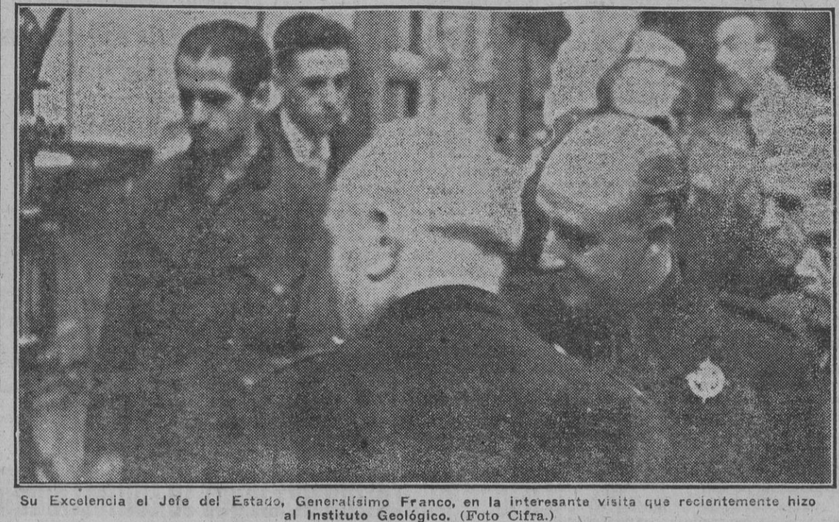
Su Excelencia el Jefe del Estado, Generalísimo Franco, en la interesante visita que recientemente hizo al Instituto Geológico.