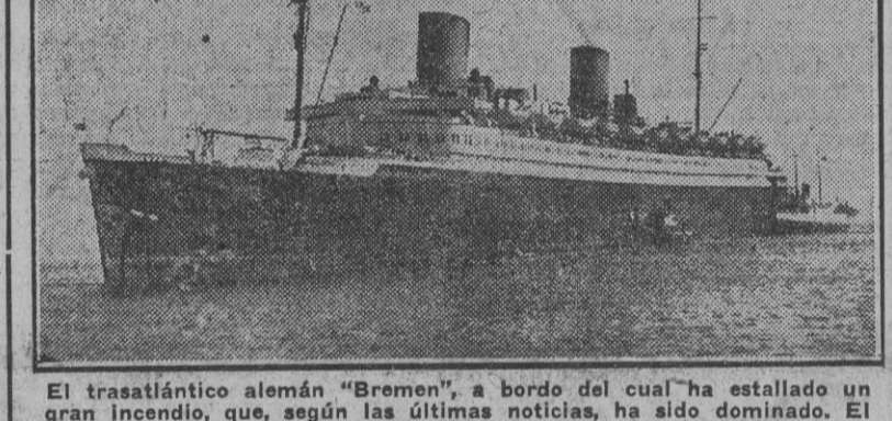
El trasatlántico alemán "Bremen", a bordo del cual ha estallado un gran incendio, que según las últimas noticias, ha sido dominado. El buque ha sufrido grandes desperfectos.