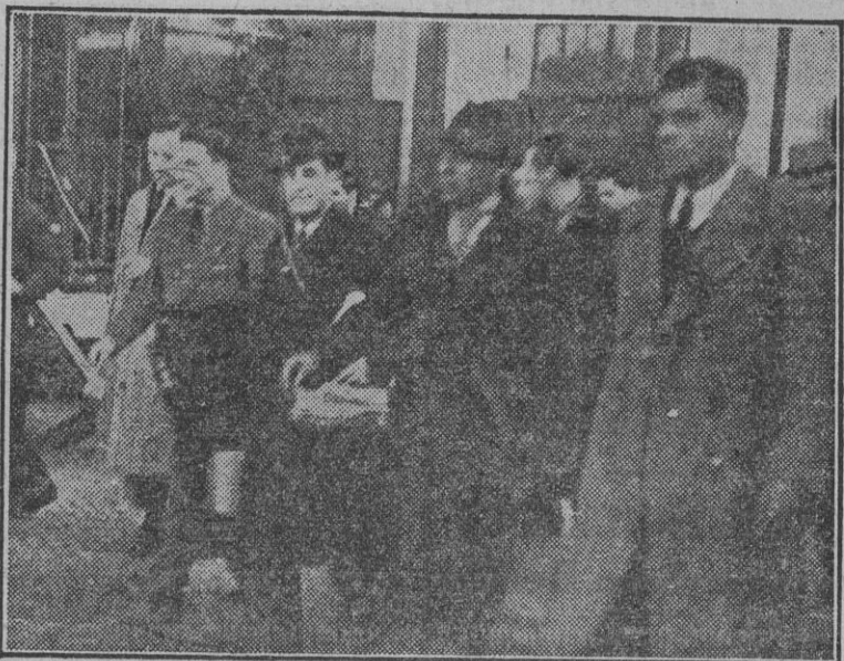
Directivos y jugadores portugueses a su llegada a la estación de las Delicias en la mañana de hoy.