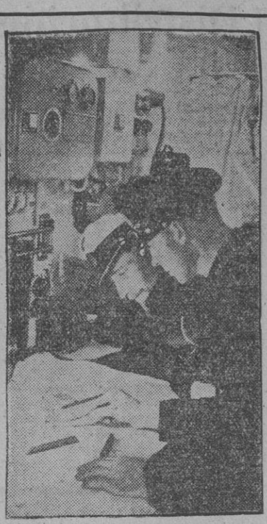
En el puesto de mando de una lancha torpedera estos dos oficiales alemanes estudian las posibilidades de encuentro con el adversario.

de excitar—aunque ingenuamente—la emoción del espectador y brindar la patria en una proporción dosis de aire libre. Dentro de este alegre marco, un sentido exacto de la disciplina castrense, patriótica, va labrando en los "novatos" la madurez de futuros héroes. Todo esto, tan serio y tan no-