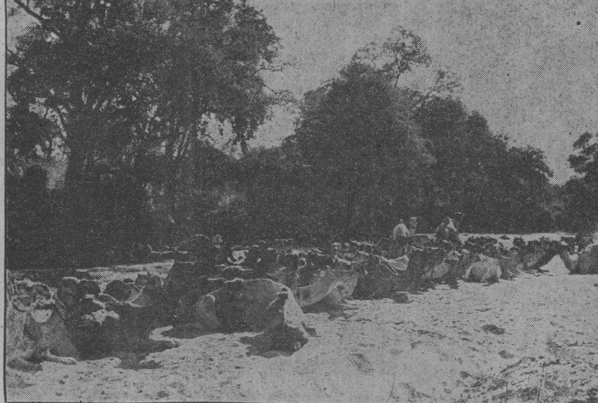
Tropas del Ejército Inglés acampadas en un oasis próximo al campo de batalla, en África Oriental.