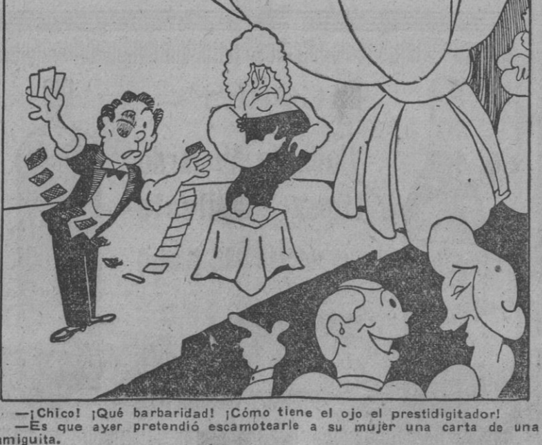
—¡Chico! ¡Qué barbaridad! ¡Cómo tiene el ojo el prestidigitador! —Es que ayer pretendí escamotear a su mujer una carta de una amiga.