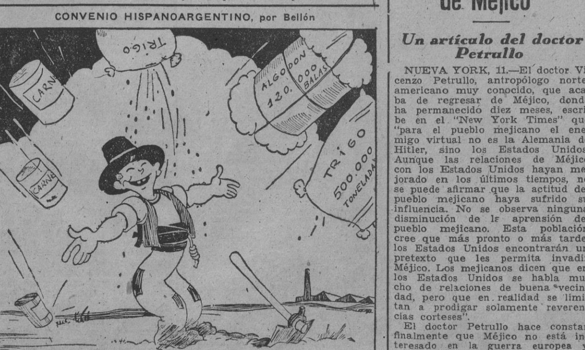
¡Ole! ¡Cosa bárbara, chel

ayer y la noche pasada, 33 aparatos. Faltan dos aviones alemanes. El teniente coronel Moellers ha alcanzado los 56 victorias aéreas. (Efe).