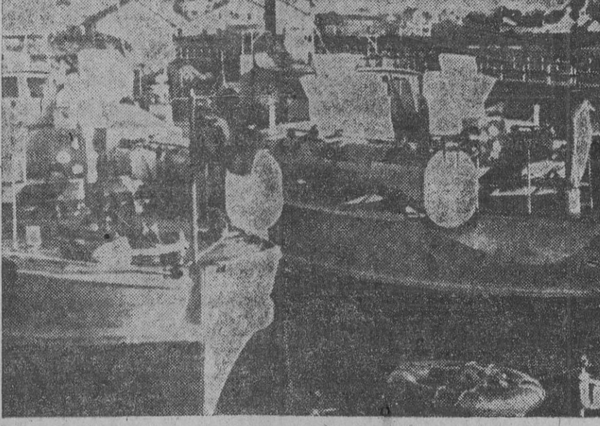
Las potentes y rápidas lanchas torpederas alemanas esperan en un puerto del Canal la orden de atacar. En la foto se aprecian los tubos lanzatorpedos de dos dichas embarcaciones, de cuya fuerza da una idea su enorme tamaño.