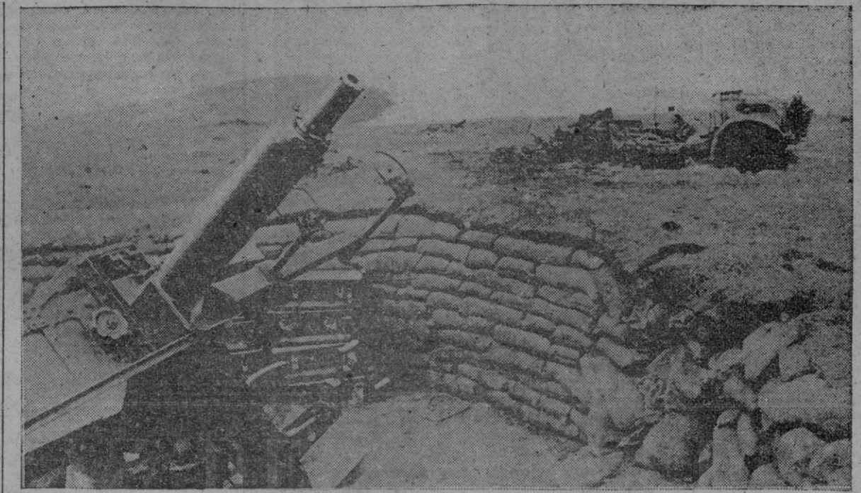
A lo largo de la costa francesa, con una densidad que asombra después de la derrota, quedan puestos fortificados donde tropas inglesas intentaron resistir el avance alemán...