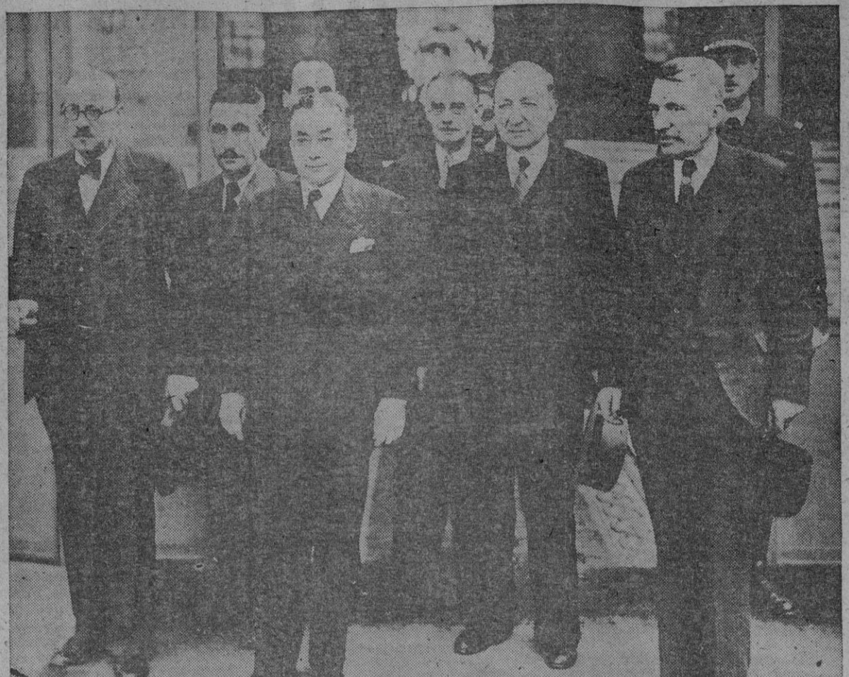
He aquí el Gobierno de la "débacle". Voluntariamente utilizamos esta palabra francesa—nosotros que siempre fuimos de los extranjerizantes—, que encierra en la máxima concisión el juicio que en su día la Historia dictará.