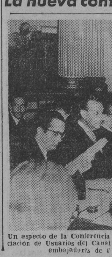
Un aspecto de la Conferencia que se está celebrando en Londres para tratar de la Asociación de Usuarios del Canal de Suez. Sentados a la mesa vemos, de izquierda a derecha, los embajadores de Portugal, España, Suecia y Turquía.