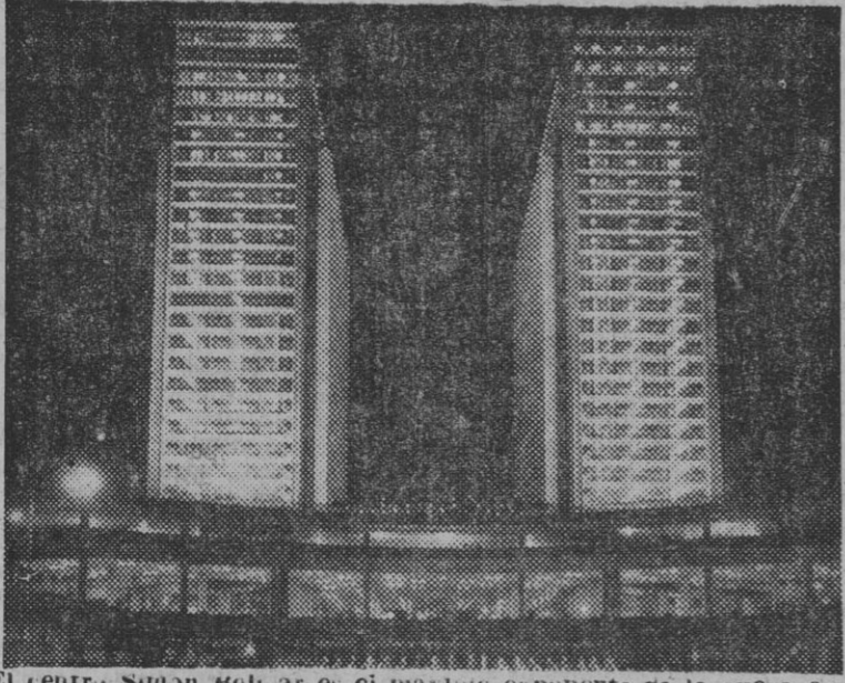
El centro Simón Bolívar es el máximo exponente de la nueva arquitectura funcional.

El puerto de Venezuela — La Guayra — tiene una fisonomía muy especial. Situado al amparo de una cadena montañosa, conserva sus instalaciones primitivas si bien modernizadas. Estas montañas, cuajadas de pequeñas casas, cuajadas de pequeñas casas, aquí denominadas "anchitos", confieren, al conjunto, personalidad única. Como país atlánticoatlanteo, que es Venezuela, posee formaciones geológicas características. El medio físico es muy diferente al de los países circundantes.