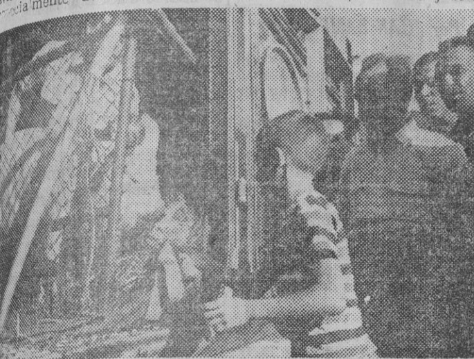
En el momento de la llegada de los 85 cerdos al aeropuerto del Prat