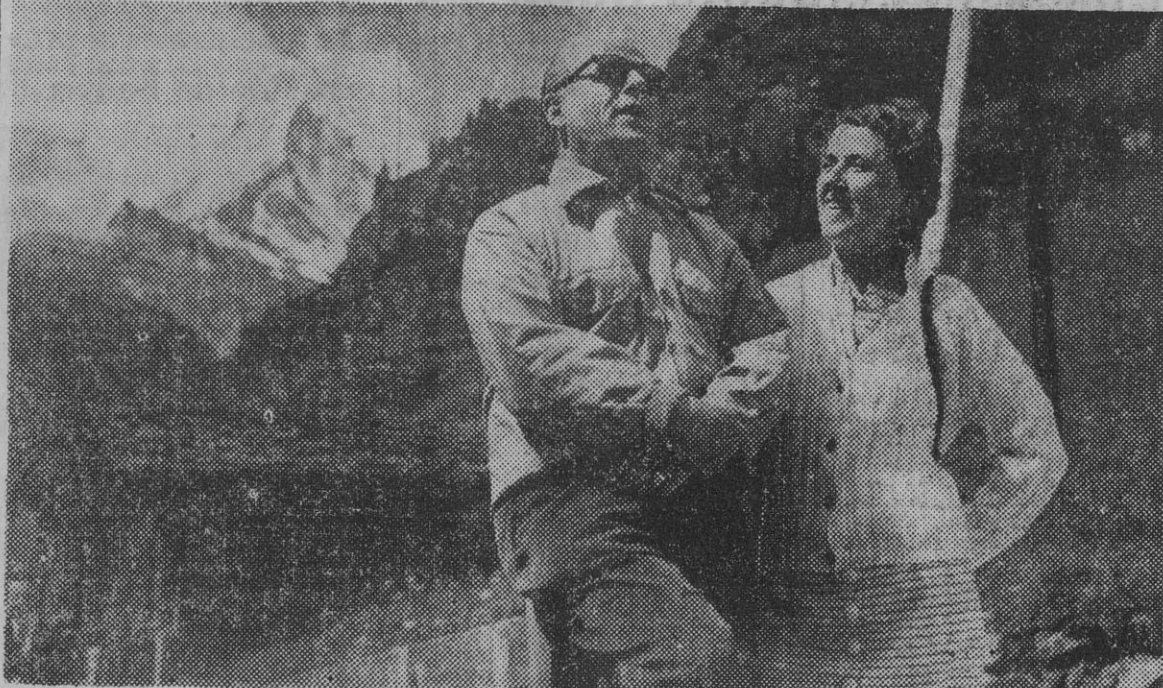
El presidente de la República italiana, señor Giovanni Gronchi, aparece fotografiado en Zermat (Alpes Suizas), donde pasa unas vacaciones con su esposa y demás familia. En el fondo el Monte Cervino.