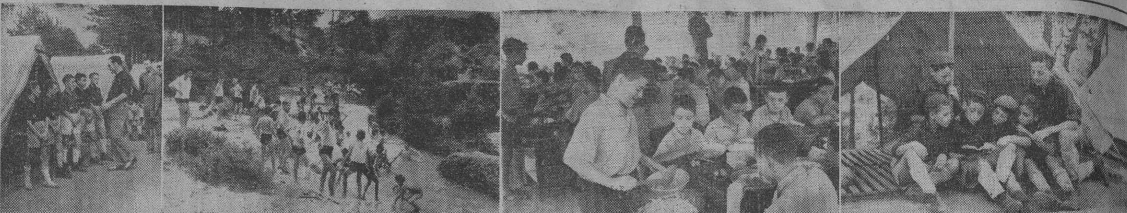
He aquí varios momentos de la visita efectuada ayer por los representantes de la Prensa de Barcelona a los diversos campamentos...