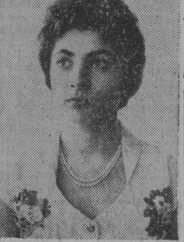
La princesa Shahnaz, hija del sha de Persia

Hasta hace muy poco en el palacio imperial pesaba la misma