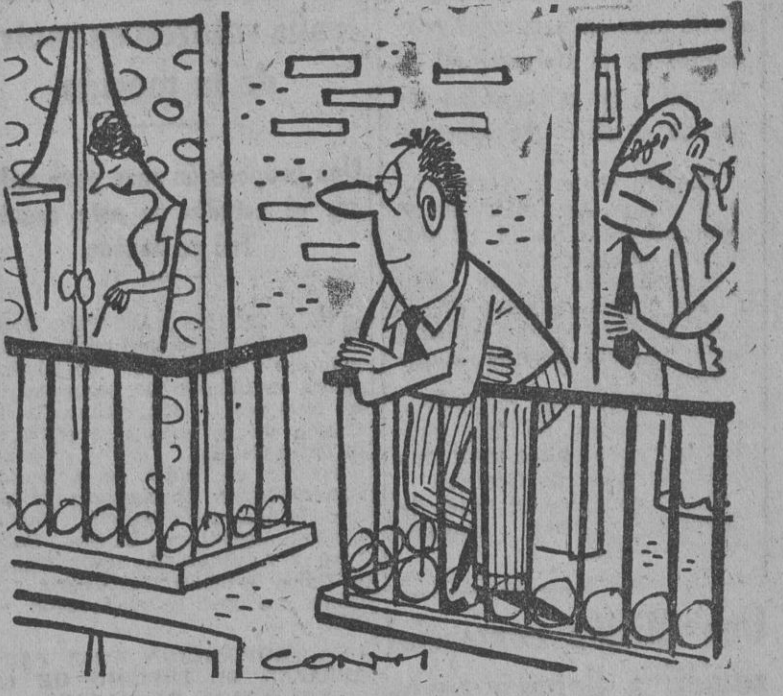
¿Te has fijado en nuestro sobrino? Desde que ha podido ver a la vecinita con la cara completamente limpia de carbonilla se ha enamorado de ella como un tonto.