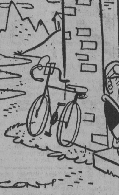
— ¡Oh, mira Ignacio! ¿No podríamos adoptarle?...