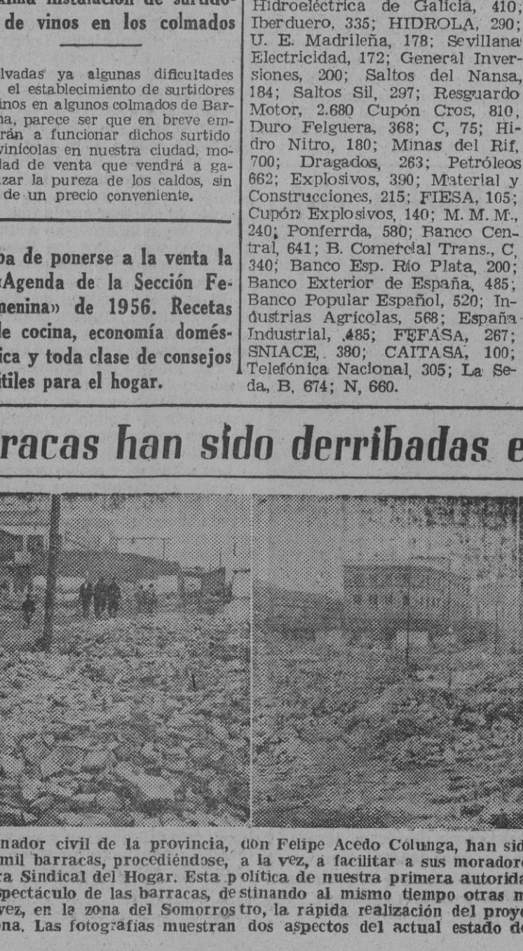
Seguiente las instrucciones del gobernador civil de la provincia, don Felipe Acedo Colunga, han sido demolidas hasta la fecha presente, en las playas de Somorrostro, mil barracas, procediéndose, a la vez, a facilitar a sus moradores viviendas sanas y económicas de las que viene construyendo la Obra Sindical del Hogar.