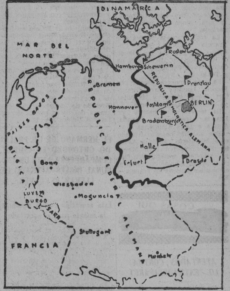
Telón de acero Despliegue de los Cuerpos de Ejército Divisiones

EN la República Federal Alemana, ha dado comienzo la instrucción del primer contingente que ha de constituir la fuerza armada del país. Aparentemente ninguna dificultad se opondrá al proceso técnico de formación, ya que la experiencia y tradición militar de Alemania es por todos reconocida, pues, no hizo Scharnhorst que de un Estado atargado sobre los laureles del Gran Federico, naciese en cinco años un ejército verdaderamente nacional a pesar de la angustiosa penuria y la vigilancia suspicaz de los comisarios de Napoleón? y ¿no se transformó con una rapidez asombrosa, pese a las grandes dificultades de toda índole, aquel pequeño ejército de cien mil hombres que toleró el Tratado de Versalles y se convirtió en la poderosa fuerza de la Wehrmacht? ¿Como ahora no va a ser posible lograr un ejército eficiente al contar con la ayuda militar de Norteamérica en su aspecto técnico y material?