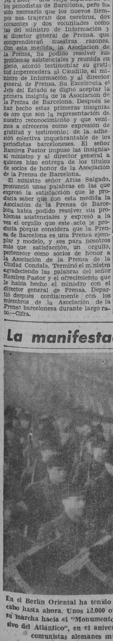
En el Berlín Oriental ha tenido lugar una de las más fuertes demostraciones de fuerza llevadas a cabo hasta ahora. Unos 12.000 obreros y jóvenes armados precedieron a unos 100.000 alemanes en su marcha hacia el "Monumento Socialista", como protesta contra "el militarismo y el pacto agresivo del Atlántico", en el aniversario de la muerte de Karl Liebknecht y Rosa Luxemburg, jefes comunistas alemanes muertos en una rebelión frustrada en 1919.