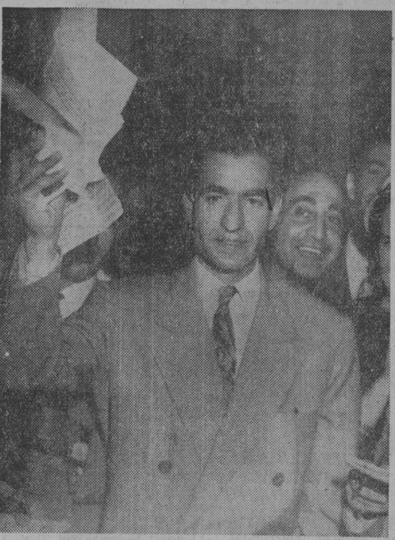
El sha de Persia muestra el cable que le fue llevado a sus habitaciones del hotel que ocupaba en Roma, comunicándole que el pueblo persa desea su vuelta al trono y la derrota de los elementos de Musaddeq.

TEHERAN, 22. (Urgente.) — El sha ha aterrizado en el aeródromo de Motarabad, cerca de Teherán, a las 11:15 horas locales. El general Záhedi, primer ministro, con el gobernador de Teherán, el prefecto de Policía, el jefe del Estado Mayor y personas de la familia real, han recibido al soberano. — Efe.