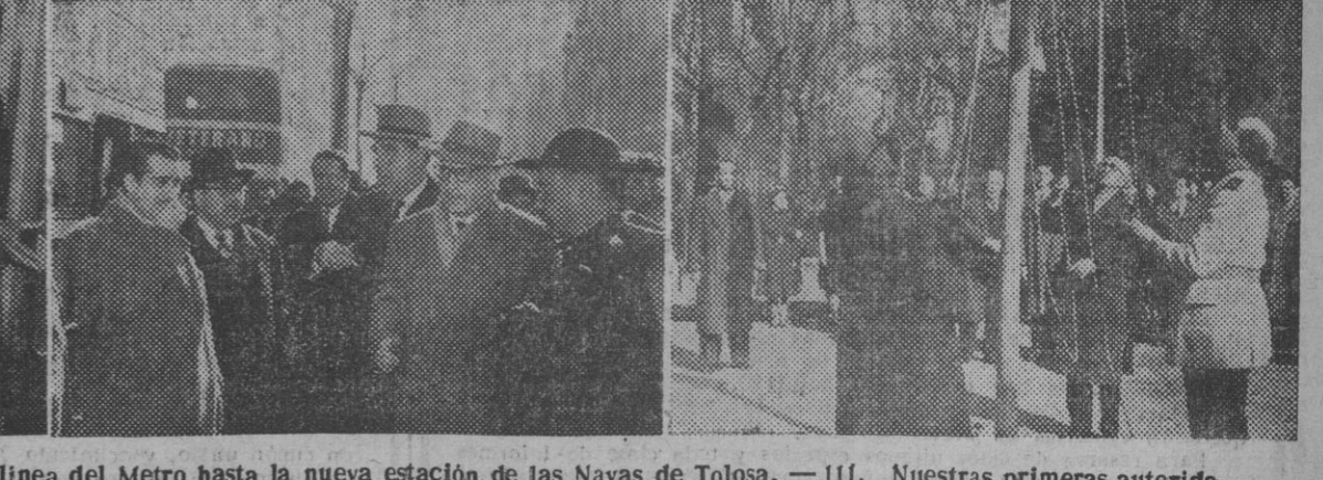
I. Presidencia del acto religioso celebrado en la basílica de Nuestra Señora de la Merced. — II. Solemne inauguración de la nueva línea del Metro hasta la nueva estación de las Navas de Tolosa. — III. Nuestras primeras autoridades haciendo el recorrido de los nuevos servicios del Metro. — IV. Las mismas personalidades durante la visita que han efectuado a las obras que se realizan en la plaza de las Glorias. — V. Momento de ser arriadas las banderas en la Escuela Virgen del Pilar, del Parque de la Ciudadela, donde han sido inauguradas hoy importantes ampliaciones.