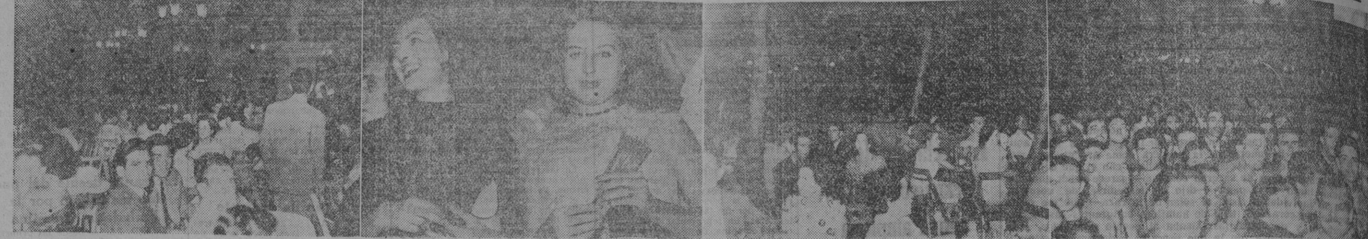
Varios aspectos de la misma y las dos "Reinas de la Sonrisa" —los votos estuvieron igualados— elegidas por la casa Dentlor a las que se les adjudicaron las dos mil quinientas pesetas. Se bailó hasta bien entrada la madrugada a los acordes de renombradas orquestas y el programa, si bien dificultosamente —debido a la enorme concurrencia— se llevó a cabo en su totalidad.