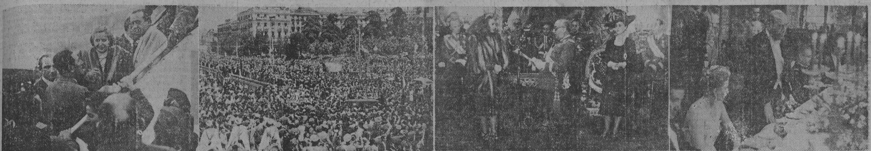
La irreparable desgracia que hoy lloran el presidente de la República Argentina y el pueblo hermano, hace retornar al primer plano periodístico aquel viaje que la noble dama hizo a nuestro país donde con su cordialidad se ganó la simpatía de los españoles. El reportaje gráfico que reproducimos, comprende: I. Eva Duarte de Perón es despedida por su esposo momentos antes de emprender su viaje en el avión español. — II. Una muchedumbre de varios cientos de miles de personas aclama con entusiasmo a la esposa del presidente argentino. — III. El Caudillo, acompañado de su esposa, lee el decreto por el que se le otorga a la ilustre dama argentina la Gran Cruz de Isabel la Católica. — IV. El alcalde de Barcelona, barón de Terrades (q. e. p. d.) ofrece el homenaje que el Ayuntamiento de la ciudad dedicó a doña Eva Duarte de Perón.