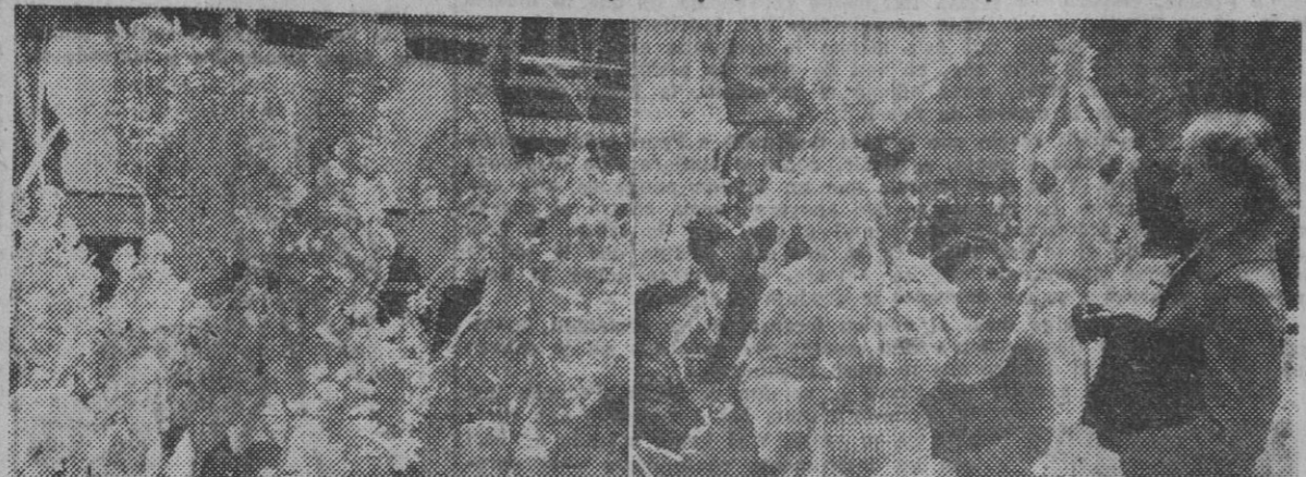
Esta mañana ha comenzado, en la Rambla de Cataluña, la tradicional venta de palmas y palmones. En las presentes fotografías puede apreciarse la labor artística que figura en la ejecución de los trabajos y la adquisición de los mismos por el público barcelonés, que prepara la celebración de la festividad del Domingo de Ramos.

Es el Viernes de Dolores el día más propicio para visitar la feria de palmas de la Rambla de Cataluña. Hoy son ya pocos los que allí se dirigen a comprar, y, por otra parte, sería difícil encontrar ya la palma más artística del año, que se la lleva