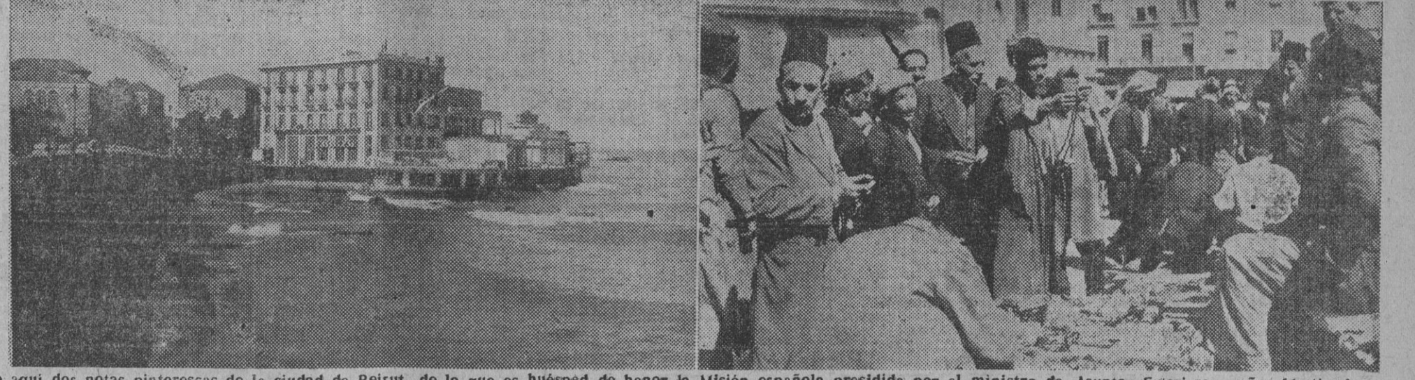
He aquí dos notas pintorescas de la ciudad de Beirut, de la que es huésped de honor la Misión española presidida por el ministro de Asuntos Exteriores, señor Martín Artajo. La primera nos muestra una bellísima perspectiva del gran hotel donde se hospeda el ministro y su séquito, y la segunda, un mercado en la vía pública, que nos recuerda nuestros zocos marroquíes.