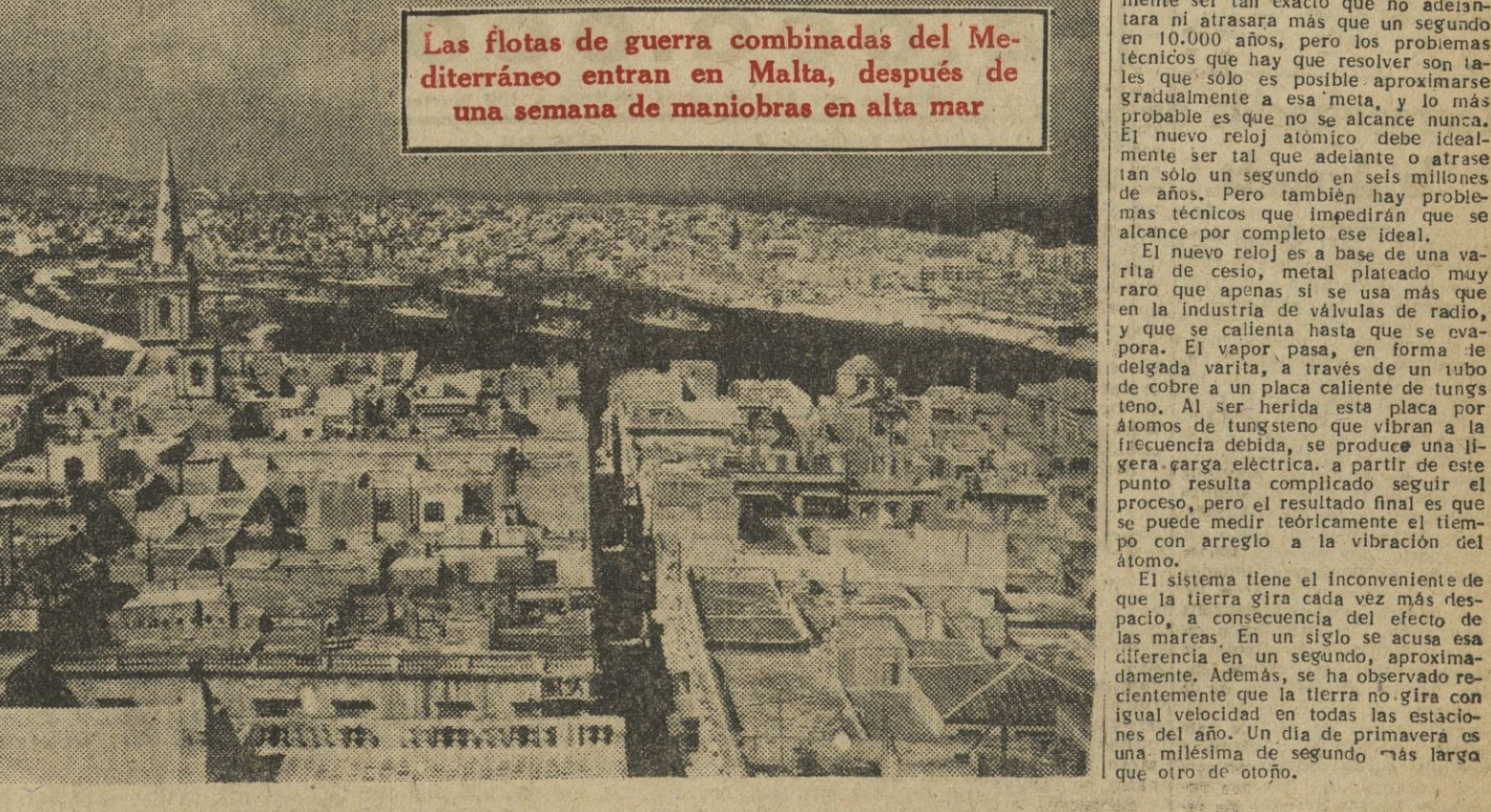
Las flotas de guerra combinadas del Mediterráneo entran en Malta, después de una semana de maniobras en alta mar

LA MAYOR PARTE DEL TRAYECTO tuvo que hacerse a mano, pero cuando, finalmente, llegó a la orilla opuesta, a las 8:20 de la mañana y pisó tierra firme, el Lord tenía todavía fuerza para hablar en la Cámara.