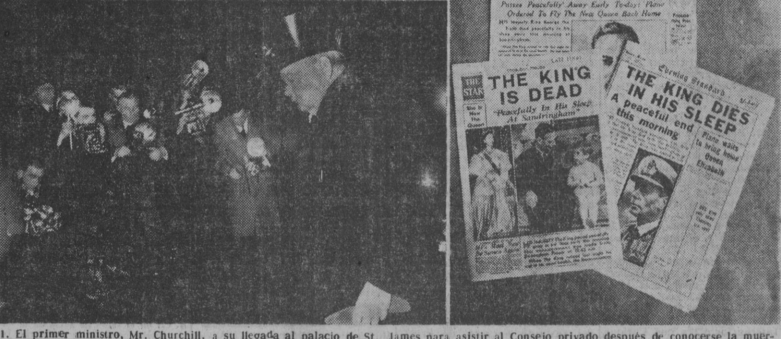
1. El primer ministro, Mr. Churchill, a su llegada al palacio de St. James para asistir al Consejo privado después de conocerse la muerte del rey Jorge VI. — 2. Así fueron las portadas de los tres principales periódicos londinenses de la tarde, para dar cuenta a sus lectores de la muerte del rey Jorge VI.

palacio de San Jaime para participar en la ceremonia, el secretario del Foreign Office, Anthony Eden, fue uno de los primeros en llegar, a pie y con el sombrero en la mano.