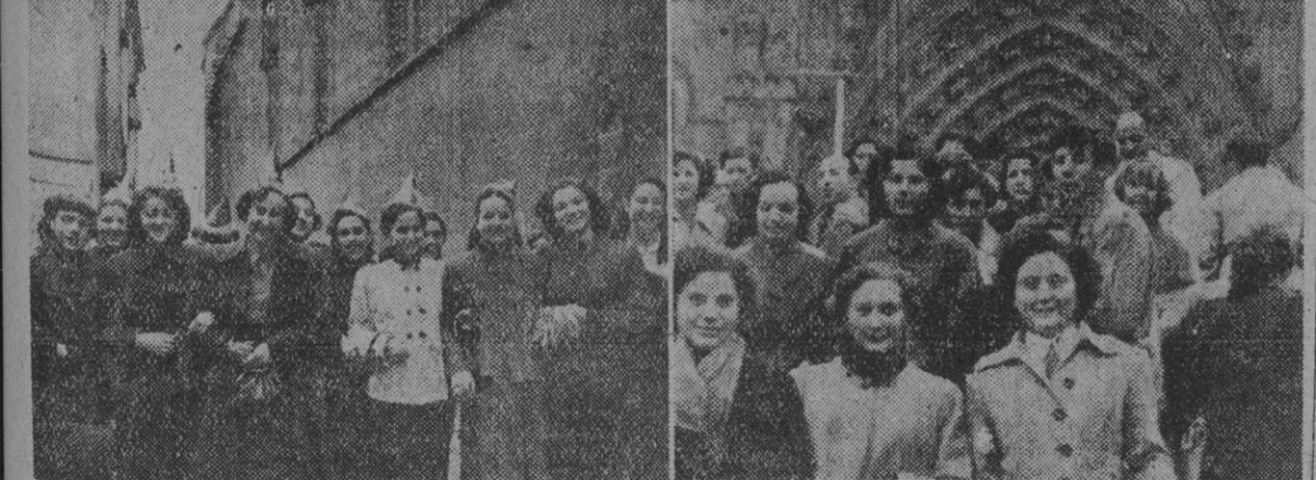
Hoy, festividad de Santa Lucía, el Sindicato Textil y las modistillas han honrado a su Patrona con diversos actos. Las alegres muchachas dedicadas a la femenina labor de coser, han puesto, con su alegría, una nota pintoresca y colorística en las calles de la ciudad. Estas dos fotografías dan prueba de la animación y alborozo de las lindas muchachas.