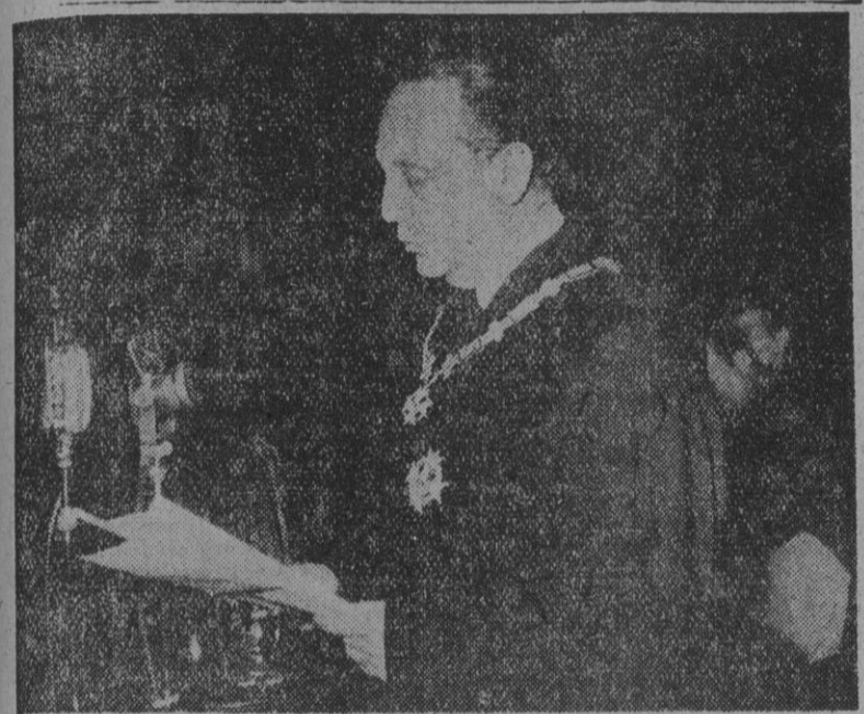
El ministro secretario general del Movimiento, don Fernández Cuesta, leyendo su discurso de ingreso en la Academia valenciana de Jurisprudencia y Legislación.

Fernández Cuesta ingresa en la Academia Valenciana de Legislación