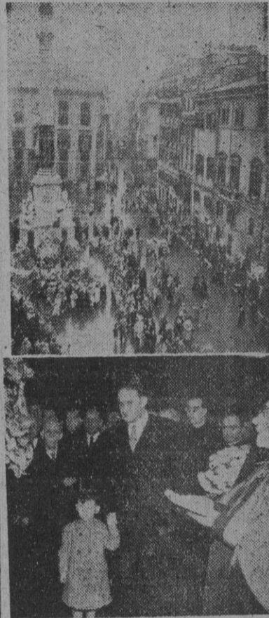
La fiesta de la Inmaculada Concepción, fué celebrada en Roma con gran esplendor. Entre los actos figura la misa oficiada ante el monumento levantado en la Plaza de España, dedicado a la Inmaculada. 1. El citado monumento. — 2. El embajador de España en la Santa Sede, señor Castiella, asiste a un acto religioso, el mismo día, celebrado también a los pies del mencionado lugar.

MADRID, 13. — Esta mañana la Marina de guerra brasileña ha rendido un homenaje en Madrid a la reina Isabel la Católica, depositando una corona de flores naturales con cintas de los colores nacionales brasileños y españoles ante la estatua de la reina, en el paseo de la Castellana.