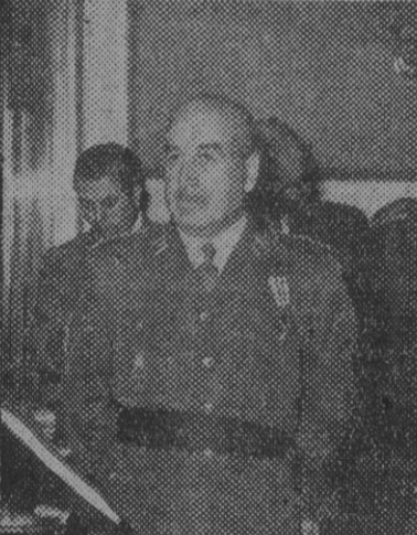
El general Garcia Valiño

interpretaban los himnos nacionales de los dos países. El alto comisario expresó al residente francés la satisfacción que sentía por hallarse éste presente en zona española e hizo votos porque su estancia en la misma fuera grata. Poco después, ambas personalidades y séquito correspondientes se trasladaron a la Residencia donde había de celebrarse la entrevista. Esta se desarrolló en términos de máxima cordialidad, tratándose temas del mayor interés para la misión de Protectorado que ambas naciones ejercen en Marruecos.