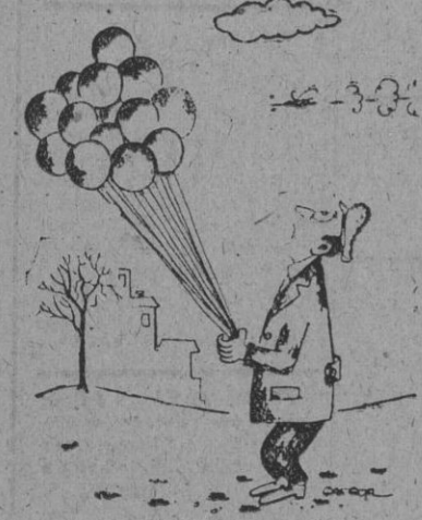
Ataque contra globos.

Según el ex embajador yanqui en el Irán, Grady