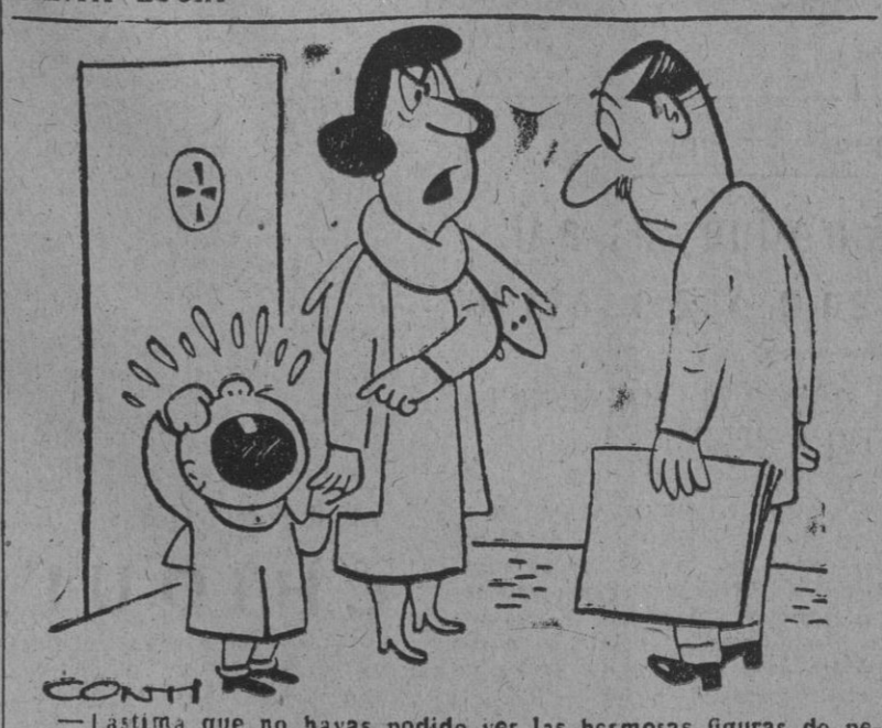
—¿Lastima que no hayas podido ver las hermosas figuras de pebre que le compré en la feria. Solo le han durado hasta la esquina.