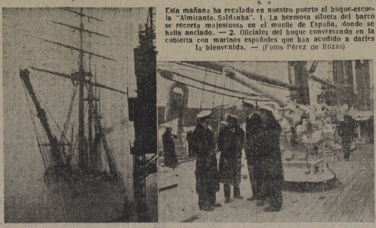
Esta mañana ha recalado en nuestro puerto el buque-escuela "Almirante Saldanha". 1. La hermosa silueta del barco se recorta majestuosa en el muelle de España, donde se halla anclado. — 2. Oficiales del buque conversando en la cubierta con marinos españoles que han acudido a darles la bienvenida.

Truman se reúne hoy en Washington con los jefes de los Estados Mayores