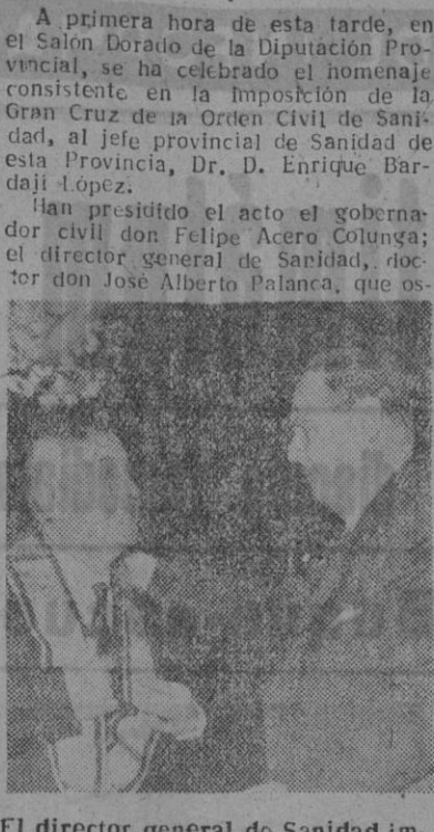
El director general de Sanidad impone la Gran Cruz de la Orden de Sanidad

HAN PRESIDIDO LA SOLEMNE CEREMONIA EL DIRECTOR GENERAL DE SANIDAD Y EL GOBERNADOR CIVIL DE ESTA PROVINCIA