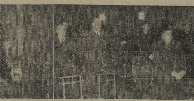
El Arma de Aviación ha rendido hoy homenaje a su excelsa Patrona, la Virgen de Loreto. 1. Momento de la ceremonia religiosa, celebrada en el Colegio de Loreto de nuestra ciudad. — 2. Presidencia de la misa. — (Fotos Pérez de Rozas)