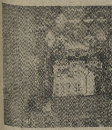
El Arma de Aviación ha rendido hoy homenaje a su excelsa Patrona, la Virgen de Loreto. 1. Momento de la ceremonia religiosa, celebrada en el Colegio de Loreto de nuestra ciudad. — 2. Presidencia de la misa. — (Fotos Pérez de Rozas)