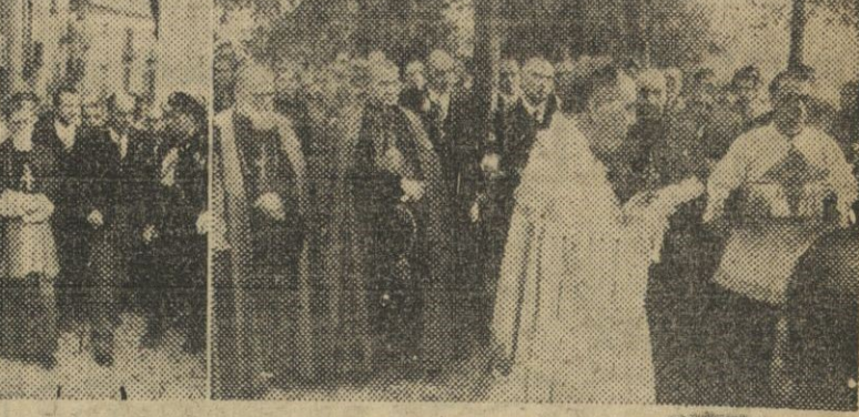
Ayer, en Tarrasa, con asistencia del director general de Asuntos Eclesiásticos y autoridades de la ciudad, se procedió a la bendición y colocación de la primera piedra de la fuente de San Valerio. 1. Las autoridades, sabiendo de la iglesia arripstral, se dirigen al lugar donde se instalará la nueva fuente. — 2. Un momento de la bendición. — (Fotos Pérez de Rozas)

Colocación de la primera piedra de una fuente, en Tarrasa