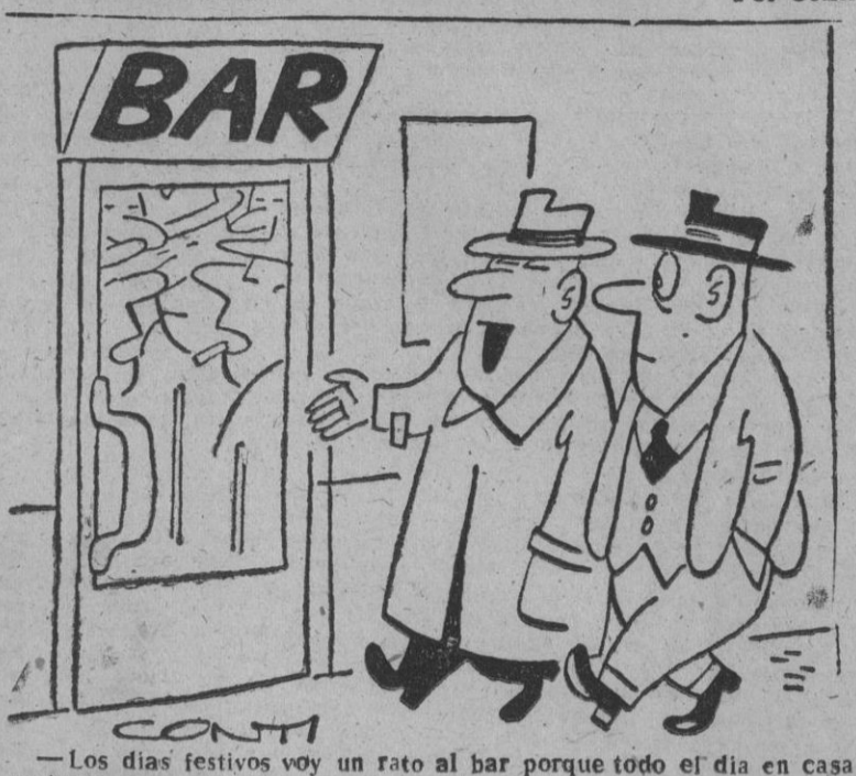
Los días festivos voy un rato al bar porque todo el día en casa se siente uno estrecho.