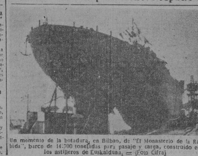
Un momento de la botadura, en Bilbao, de "El Monasterio de la Rábida", barco de 14.700 toneladas para pasaje y carga, construido en los astilleros de Euskalduna.