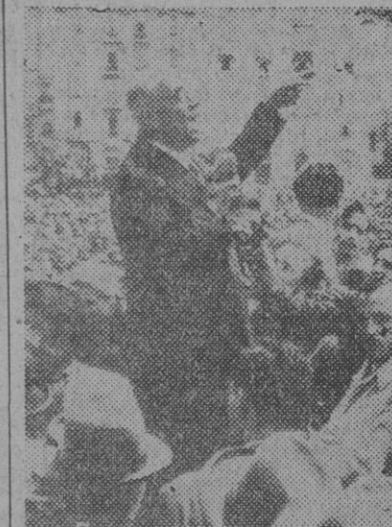
Turca, Celal Bayar, en su discurso de apertura del Parlamento.

ANKARA, 3. — El establecimiento de una más estrecha colaboración entre España, país mediterráneo, y el resto del mundo libre, está en el interés general de la paz, ha declarado el presidente de la República