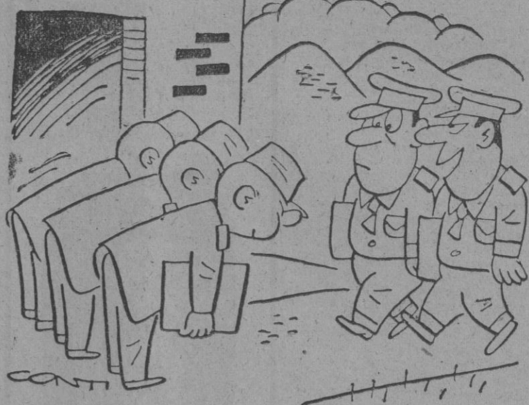
— Están muy amables hoy. Deben haber leído el resultado de las maniobras atómicas.