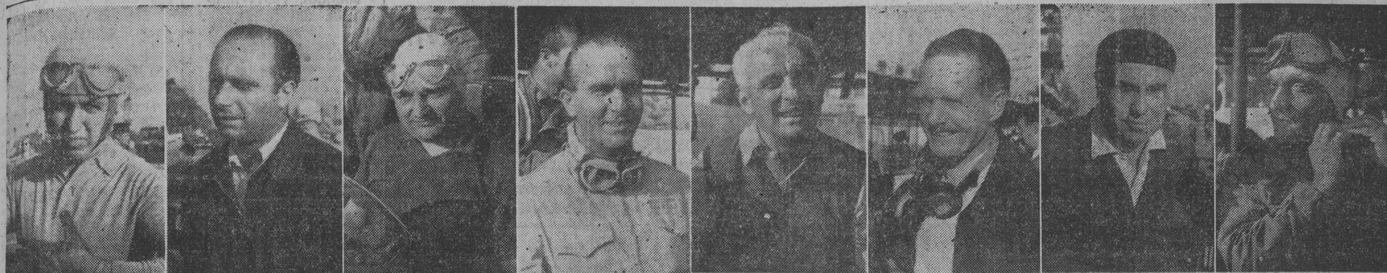
Mañana se corre en Pedralbes la última prueba del Campeonato del Mundo de 1951. He aquí los favoritos de este sensacional acontecimiento deportivo: 1, Alberto Ascari, de Italia. — 2, Juan Manuel Fangio, de Argentina. — 3, José Froilán González, de Argentina. (Estos tres pilotos decidirán entre sí el título de campeón del Mundo). — 4, Nino Farina, de Italia. — 5, Luigi Villorosi, de Italia. — 6, Barón de Grafenried, de Suiza. — 7, Piero Taruffi, de Italia. — 8, Bonetto, de Italia. — Este será el orden de colocación en la salida: — E1, 1, 3, 5 y 7, corren bajo los colores de "Ferrari". E2, 4, 6 y 8, bajo los de "Alfa Romeo". — (Fotos Pérez de Rozas)