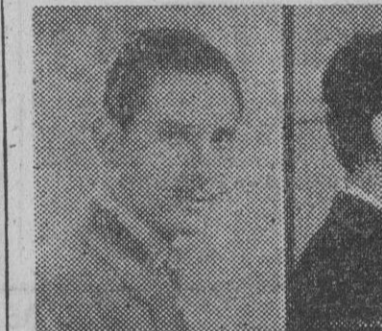
Estas cuatro instantáneas pertenecen al pistolero José Lluís Facerías, autor de numerosos delitos de sangre, y cuya detención de varios miembros de su banda se ha llevado a cabo

los del "gang", que trasladaban por la calle de Calabria, invitados a entregarse, los pistoleros contestaron a tiros y arrojando bombas de mano, estableciendo un nutrido tiro, resultando ambos pistoleros heridos y obligados a refugiarse en una casa aislada de los alrededores. La captura tuvo sus ribetes cinematográficos, puesto que la primera escena