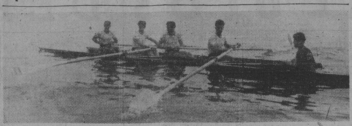
He aquí a la embarcación española en la semifinal de la prueba de cuatro remeros, en el río Saone, correspondiente a los Campeonatos europeos de Remo.