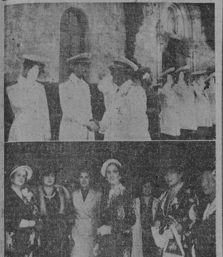
1. S. E. el Jefe del Estado a su llegada al Pazo de Meirás es saludado por los jefes y oficiales de su Casa Militar. — 2. A su llegada al Pazo de Meirás, la esposa de S. E. el Jefe del Estado, doña Carmen Polo de Franco, es recibida por distinguidas damas que le dieron la bienvenida.

Su Excelencia el Jefe del Estado y su esposa en el Pazo de Meirás