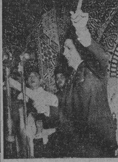
El primer ministro Mustafá Nahas Pasha, de Egipto, dice en una reunión del partido waadista que Egipto romperá en breve el tratado de defensa de 1936 que tiene con Gran Bretaña. La reunión se celebró para conmemorar el XXIV aniversario de la muerte de Saad Zaghloul, el héroe nacional de Egipto.

Manifestaciones del primer ministro egipcio