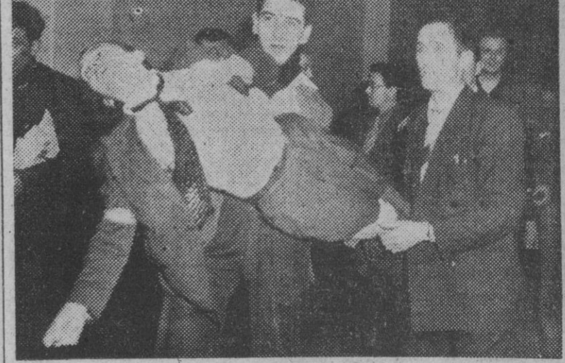
De la Sala Wagram, de París, es sacada esta víctima de una bomba de gases lacrimógenos que hizo explosión durante un mitin de los comunistas franceses antimoscovitas.