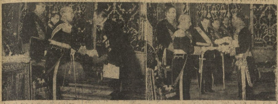
1. Don Antonio Facio Ulloa, en el momento de hacer entrega a S. E. el Jefe del Estado de las cartas que le acreditan como embajador de Costa Rica en España. — 2. También el ministro de Persia, señor Abolhassan Ebichadjim, entregó ayer al Generalísimo sus pleni-potencias.