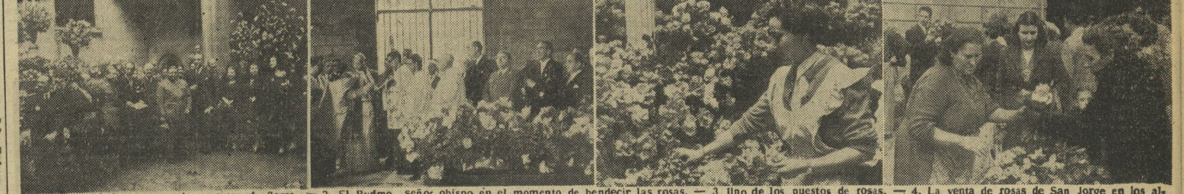
1. Las autoridades recorren los puestos de flores. — 2. El Rvdmo. señor obispo en el momento de bendecir las rosas. — 3. Uno de los puestos de rosas. — 4. La venta de rosas de San Jorge en los alrededores de la Diputación. — (Fotos Pérez de Rozas)