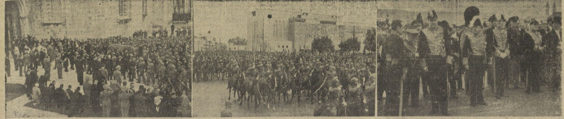
El pueblo portugués asistió en imponente manifestación de duelo al entierro del que durante tantos años rigió los destinos del país hermano. El reportaje gráfico nos da cuenta de esa manifestación popular y nacional. 1. Momento de la llegada de los restos del mariscal Carmona al panteón nacional de los Jerónimos, donde recibieron sepultura. — 2. Un aspecto del desfile militar que acompañó al cadáver del mariscal desde la Asamblea hasta el panteón de los Jerónimos.—3. El ministro español de Asuntos Exteriores, don Alberto Martín Artajo, al frente de la Misión española que asistió al entierro del presidente portugués.—(Fotos Cifra)